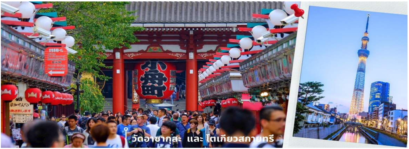
CXJNR3 โตเกียว พุจิ คาวาซากิ ไร่ชาเขียว เทียวเต็ม ไม่มีอิสระ 5วัน 3คืน บิน XJ (MAY-SEP 25)

08.00 น. เดินทางถึงสนามบินนาริตะ ประเทศญี่ปุ่น หลังจากผ่านพิธีตรวจคนเข้าเมืองและศุลกากรแล้ว นำท่านขึ้นรถโค้ชปรับอากาศ จากนั้นเดินทางสู่ เมืองโตเกียว พาท่านสักการะ ที่ วัดอาซากุสะ (Asakusa Temple) วัด ที่ได้ชื่อว่าเป็นวัดที่มีความศักดิ์สิทธิ์และได้รับความเคารพนับถือมากที่สุดแห่งหนึ่งในกรุงโตเกียวภายในประดิษฐานองค์ เจ้าแม่กวนอิมทองคำที่มีกจะมีผู้คนมากราบไหว้ขอพรเพื่อความเป็นสิริมงคลตลอดทั้งปี ประกอบกับภายในวัดยังเป็น ที่ตั้งของโคมไฟยักษ์ที่มีขนาดใหญ่ที่สุดในโลกด้วยความสูง 4.5 เมตรซึ่งแขวนห้อยอยู่ ณ ประตูทางเข้าที่อยู่ด้านหน้าสุด ของวัดที่มีชื่อว่า “ประตูฟ้าคาร์ณ” บริเวณทางเข้าสู่ตัววิหารจะมี “ถนนนากามิเซะ” ซึ่งเป็นที่ตั้งของร้านค้าขายของที่ ระลึกพื้นเมืองต่างมากมายเช่น หน้ากาก ของเล่น รองเท้า พวงกุญแจ ของที่ระลึก และขนมหวานชนิดทั้งเมลอนปังใน ตำนาน ดังโงะหนับหนับและน้องปลาขนมไทยากิ ฯลฯ ให้ทุกท่านได้เลือกซื้อเป็นของฝากของที่ระลึก ให้จากนั้นนำท่าน แวะถ่ายรูปกับ “TOKYO SKYTREE” (ด้านนอก) ที่บริเวณสะพานข้ามแม่น้ำสุมิตะหนึ่งในแลนด์มาร์คของโตเกียวเป็น หอคอยส่งสัญญาณโทรทัศน์ที่เป็นสิ่งปลูกสร้างที่สูงที่สุดในญี่ปุ่นและเป็นหอคอยที่สูงที่สุดในโลกตั้งอยู่ที่เขตสุมิตะหน้าที่ หลักของโตเกียวสกายทรีคือการกระจายสัญญาณสื่อสารแบบดิจิตอลและโตเกียวสกายทรียังแทรกความเป็นมาของ