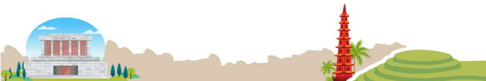
1 ภาพใช้เพื่อการโฆษณาเท่านั้น

ในกรณีที่ผู้โดยสาร มีไฟล์ทเดินทางภายในประเทศหรือระหว่างประเทศ ที่เกี่ยวข้องกับวันเดินทางที่ท่านได้ทำการจองไว้กับทางบริษัทฯ กรุณาแจ้งให้ทางเจ้าหน้าที่ทราบก่อนการชำระเงินค่าตั๋วดังกล่าว ถ้าเกิดข้อผิดพลาด ทางบริษัทฯ ขอสงวนสิทธิ์ในการรับผิดชอบทุกกรณี