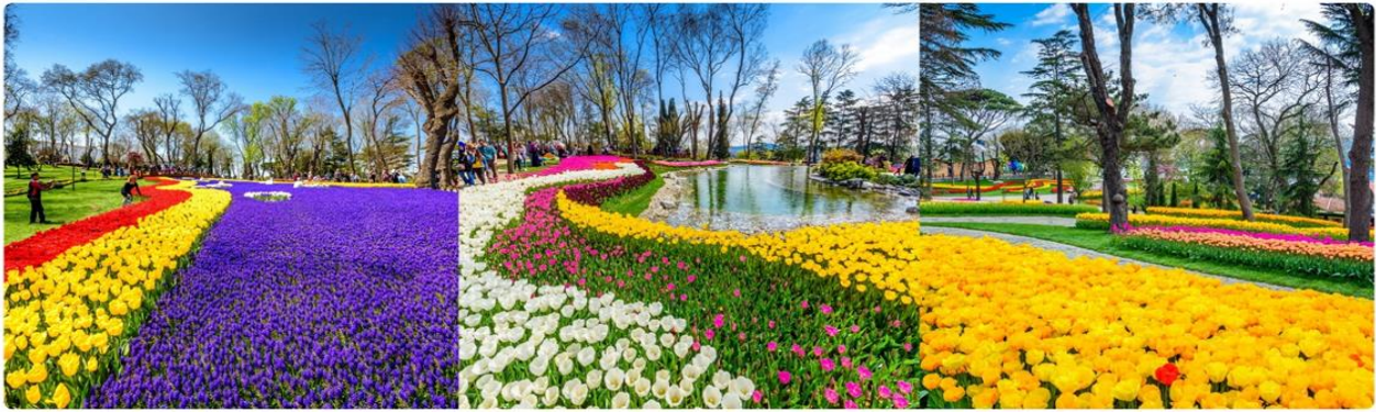
*ภาพเพื่อการโฆษณาเท่านั้น

นำทุกท่านเข้าชม สวนดอกทิวลิป (เทศกาลดอกทิวลิปเปิดให้เข้าชมระหว่างวันที่ 1-30 เมษายนเท่านั้น) สวนดอกทิวลิปหลากสีหลายสายพันธุ์นับล้านดอกที่สวยงามที่สุด และมีชื่อเสียงที่สุดของตุรกี ตลอดเดือนเมษายน เทศกาลทิวลิปอิสตันบูล เป็นเทศกาลประจำปี โดยจะจัดในช่วง 3 สัปดาห์สุดท้ายของเดือนเมษายน เพื่อเฉลิมฉลองทั้งฤดูใบไม้ผลิ และความสำคัญของดอกทิวลิป ที่มีต่ออาณาจักรออตโตมัน และวัฒนธรรมตุรกี ปกติแล้วเทศกาลนี้จัดขึ้นที่สวนสาธารณะ ที่มีชื่อเสียงที่สุดของเมือง ให้ทุกท่านได้ถ่ายรูปตามอัธยาศัย