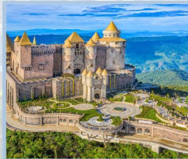
ปราสาทจันทร