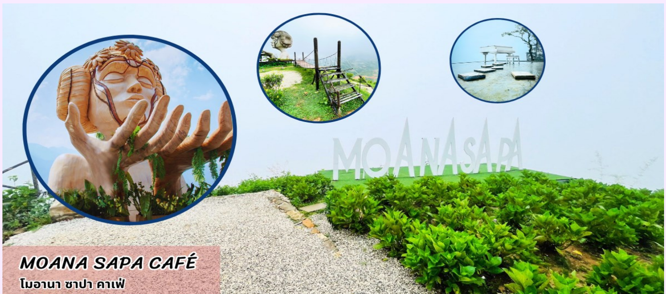
MOANA SAPA CAFÉ โมอานา ซาปา คาเฟ่

นำท่านเช็คอินแลนด์มาร์คแห่งใหม่ของซาปา โมอาน่า ซาปา คาเฟ่ (MOANA SAPA CAFÉ) จำลองไฮไลท์ของที่เที่ยวดังแต่ ละที่มารวมไว้ให้ท่านได้ถ่ายรูปท่ามกลางบรรยากาศที่โอบล้อมไปด้วยภูเขา ให้ท่านอิสระเลือกซื้อเครื่องดื่ม และเพลิดเพลินกับสายหมอกต่างๆ พร้อมกับบรรยากาศสุดฟิน อิสระให้ถ่ายภาพตามอัธยาศัย