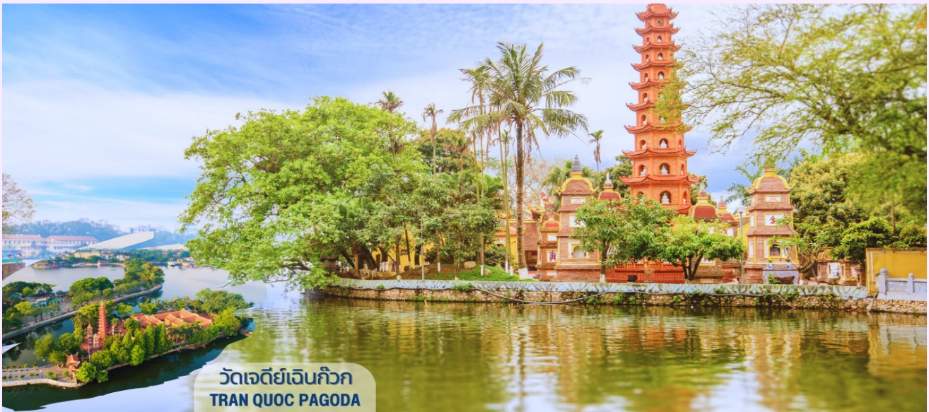
วัดเจดีย์เงินก๊ก TRAN QUOC PAGODA

จะมีขนาดเล็กลงตามความสูง ที่ช่องหน้าต่างของแต่ละชั้นจะเป็นที่ประดิษฐานของประติมากรรมพระพุทธรูป อมิตาภ พุทธเจ้า ตามความเชื่อของพุทธมหายาน ซึ่งมองเห็นเด่นชัดจากภายนอก ไล่เรียงขึ้นไปตรงกัน ตัวเจดีย์ก่อสร้างด้วยอิฐ สีแดง โข่วให้เห็นการซ้อนของอิฐ ชั้นล่างด้านหน้าจะมีแท่นสำหรับให้นักท่องเที่ยวบูชา ภายในมีจารึกประวัติความเป็นมาทั้งของเจดีย์และพระศรีศากยมุนีปางปริณิพพานที่ทำด้วยทองคำ