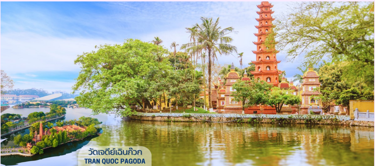
วัดเจดีย์เงินก๊ก TRAN QUOC PAGODA

จะมีขนาดเล็กลงตามความสูง ที่ช่องหน้าต่างของแต่ละชั้นจะเป็นที่ประดิษฐานของประติมากรรมพระพุทธรูป อมิตาภ พุทธเจ้า ตามความเชื่อของพุทธมหายาน ซึ่งมองเห็นเด่นชัดจากภายนอก ไล่เรียงขึ้นไปตรงกัน ตัวเจดีย์ก่อสร้างด้วยอิฐ สีแดง โข่วให้เห็นการซ้อนของอิฐ ชั้นล่างด้านหน้าจะมีแท่นสำหรับให้นักท่องเที่ยวบูชา ภายในมีจารึกประวัติความเป็นมาทั้งของเจดีย์และพระศรีศากยมุนีปางปริณิพพานที่ทำด้วยทองคำ