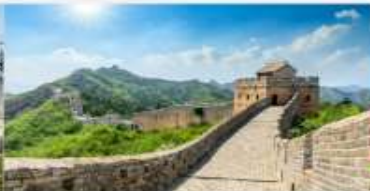
ท่าแพงเมืองจีน