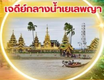
เจดีย์กลางน้ำเยเลพญา