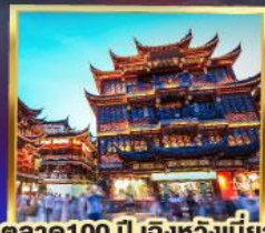
ตลาด 100 ปี เติ้งหวังเหมี่ยว