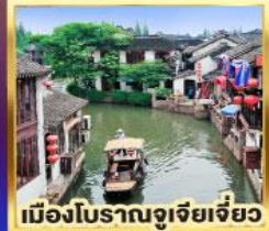
เมืองโบราณจูเจียเจี๋ย