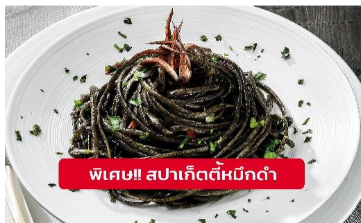
พิเศษ!! สปาเก็ตตี้หมึกดำ

🍴 รับประทานอาหารเที่ยง (มือที่9) เมนูพิเศษ!! สปาเก็ตตี้หมึกดำ