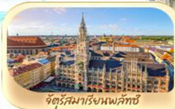
จัตุรัสมาเรียนพลาทซ์