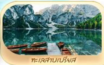
ทะเลสาบเบรียงส