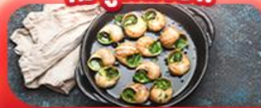
เซอชออสคาโท