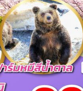
ฟาร์มหมีสีน้ำตาล