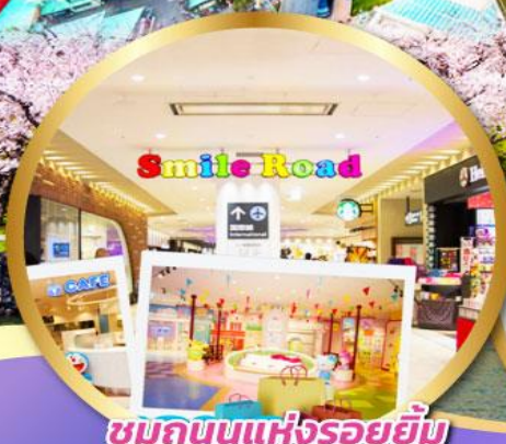
ชมถนนแห่งรอยยิ้ม