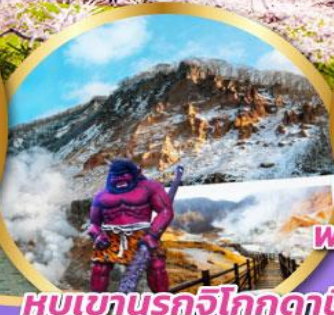
หุบเขารกจิโกกุตามิ