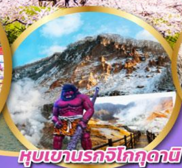
หุบเขารถจิ๋วโกกูดานิ