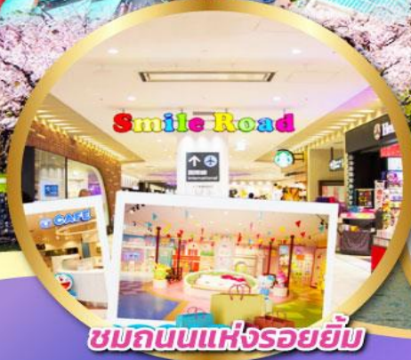
ชมถนนแห่งรอยยิ้ม