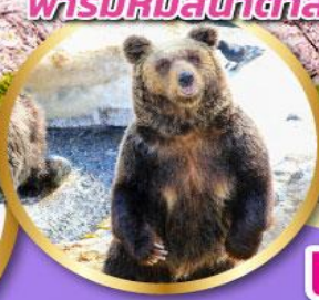
ฟาร์มหมีสีน้ำตาล