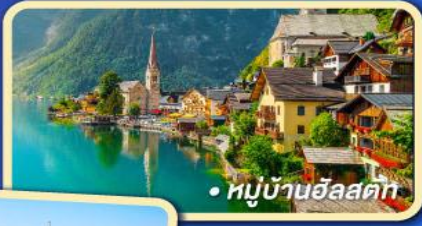
• หมู่บ้านฮัลสตัดท์