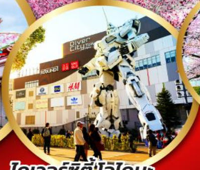
โตเออร์ซิตีโอโดบะ