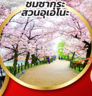
ชมซากุระสวนอุเอโนะ