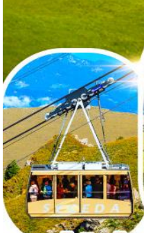
กระเช้าซิคเค้า