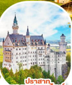
ปราสาท นอยชวานชไตน์