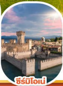
ซีร์มิโอเน่

เดินทาง 28 เม.ย. - 04 พ.ค. 68 30 พ.ค. - 05 มิ.ย. 68 11-17 มิ.ย. 68