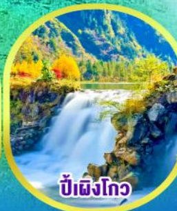
ปี้เผิงโกว