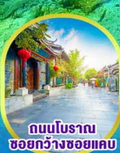
ถนนโบราณ ชอยกวางชอยแคบ