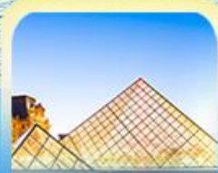
พีพรัมิดทูลูฟ