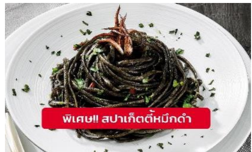
พิเศษ!! ส�파เก็ตตี้หมึกดำ

Highlight! เมื่อเยือนเกาะเวนิส เมนูที่ขึ้นชื่อและหากได้มาต้องได้ลิ้มลองสปาเก็ตตี้ผัดซอสหมึกดำที่คลุกเคล้ากับความหอมนุ่มนัวกับบรรยากาศ สุดคลาสสิคฉบับอิตาเลียนต้นตำรับเวนิส