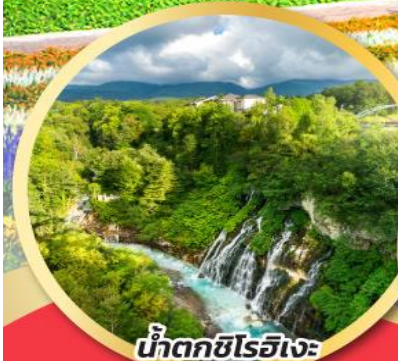
น้ำตกชิโรอิเงะ