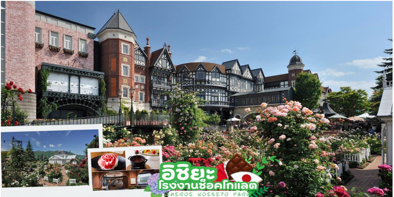
โอชิยะ โรงงานช็อคโกแลต SHIROI CHOCOLATE PARLV

ท่านเดินทางสู่ ศาลเจ้าฮอกไกโด (Hokkaido shrine) ศาลเจ้าแห่งนี้ตั้งอยู่ที่ซัปโปโร เป็นศาลเจ้าศาสนาพุทธนิกายชินโตถือเป็นศาลเจ้าที่มีความเก่าแก่แห่งหนึ่งในเกาะฮอกไกโด ถูกสร้างขึ้นในปี ค.ศ. 1871 ในปัจจุบันก็ยังคงมีความเกี่ยวข้องกับวิถีชีวิตของชาวฮอกไกโดอย่างลึกซึ้ง เริ่มตั้งแต่การมาสักการะในวันปีใหม่ การปิดเป่ารังควาญ วันเซ็ตสึบุณ พิธีสมรสและอื่น ๆ เป็นต้น ในเขตศาลเจ้าที่มีธรรมชาติอุดมสมบูรณ์ มีกระรอกป่ามาเยี่ยมทักทาย