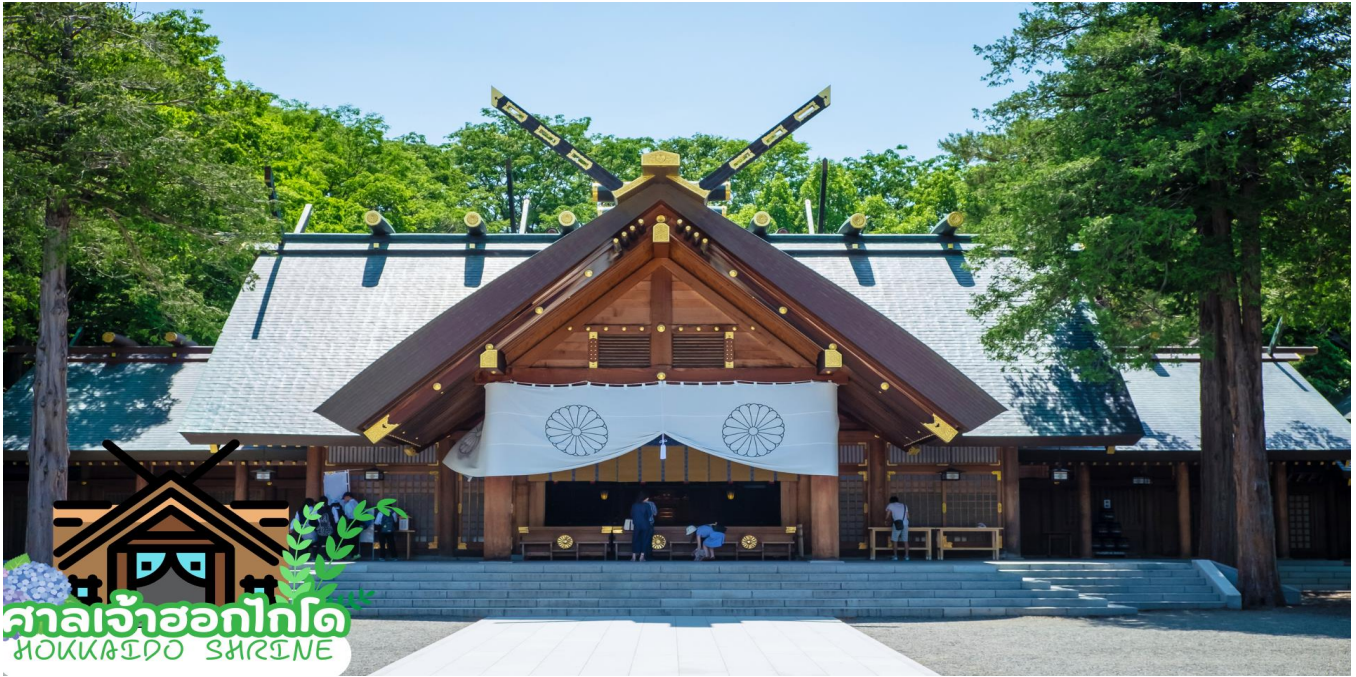
ศาลเจ้าฮอกไกโด HOKKAIDO SHRINE

ท่านเดินทางสู่ ศาลเจ้าฮอกไกโด (Hokkaido shrine) ศาลเจ้าแห่งนี้ตั้งอยู่ที่ซัปโปโร เป็นศาลเจ้าศาสนาพุทธนิกายชินโตถือเป็นศาลเจ้าที่มีความเก่าแก่แห่งหนึ่งในเกาะฮอกไกโด ถูกสร้างขึ้นในปี ค.ศ. 1871 ในปัจจุบันก็ยังคงมีความเกี่ยวข้องกับวิถีชีวิตของชาวฮอกไกโดอย่างลึกซึ้ง เริ่มตั้งแต่การมาสักการะในวันปีใหม่ การปิดเป่ารังควาญ วันเซ็ตสึบุณ พิธีสมรสและอื่น ๆ เป็นต้น ในเขตศาลเจ้าที่มีธรรมชาติอุดมสมบูรณ์ มีกระรอกป่ามาเยี่ยมทักทาย