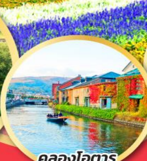
คลองโอตารุ