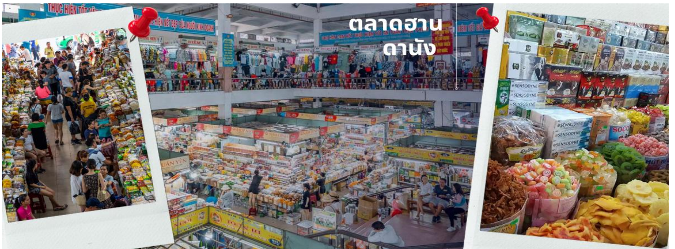
ตลาดฮาน ดานัง

นำท่านไปละลายทรัพย์ที่ ตลาดฮาน เป็นตลาดที่รวบรวมสินค้ามากมายเป็นที่นิยมทั้งชาวเวียดนามและชาวไทย อาทิ เสื้อเวียดนาม หมวก รองเท้า กระเป๋า สินค้าพื้นเมือง โดยเฉพาะงานฝีมือ อาทิ ภาพผ้าปักมืออันวิจิตร โคมไฟ ผ้าปัก กระเป๋าปัก ตะเกียบไม้แกะสลัก ชุดอ่าวหย่าย (ชุดประจำชาติเวียดนาม) ฯลฯ ไว้เป็นที่ระลึกมากมายเพื่อฝากคนที่บ้าน