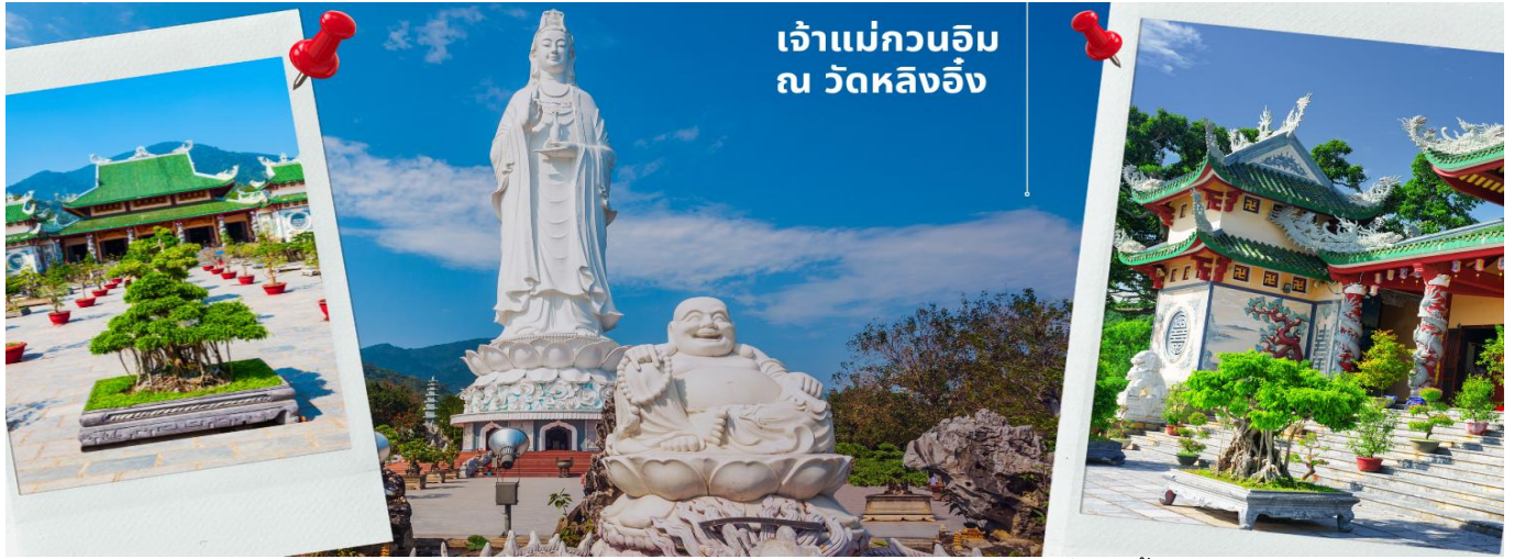
เจ้าแม่กวนอิม ณ วัดหลิงอิ่ง

CVZD12 ดานัง - ฮอยอัน - ไร่ เทียวครบพักบานาฮิลล์ 4 วัน 3คืน บิน VZ (APR-OCT 25)