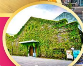
Huashan 1914 Creative Park