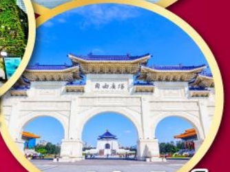
อนุสรณ์เจียงไคเช็ค

GO1CNXTPE-JX009 ไปแล้วกันเดี๋ย ..ไปแล้วกันเดี๋ย ..บินตรง เชียงใหม่ ได้วัน ตลอด 2 อุทยาน 5 วัน 4 คืน STARLUX (JX)