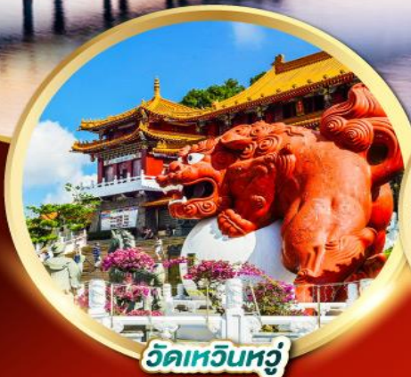
วัดเหวินหัว