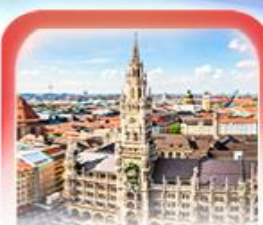
จัตุรัสมาเรียนพลัทซ์