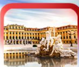
พระราชวังเชินบรุนน์