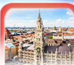
จัตุรัสมาเรียนพลัทซ์