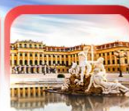
พระราชวังเชินบรุนน์