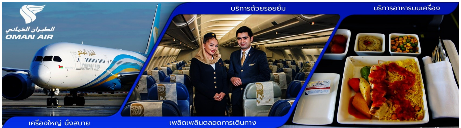
เครื่องบิน บังสabay

* การจัดที่นั่งบนเครื่องบินเป็นไปตามระบบสายการบินแบบหมู่คณะ ไม่สามารถเลือกที่นั่งได้ *