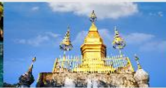
พระธาตุพูสี