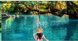
บลูลากูน