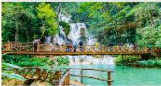
เขตกตาดกวางสี