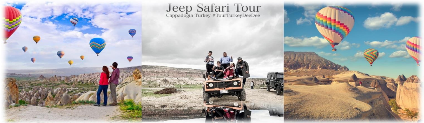
หน้า 10 (ภาพใช้เพื่อการโฆษณาเท่านั้น)

3. รถคลาสสิกทัวร์ (Classic Tour) สำหรับท่านใดที่สนใจชมความสวยงามของเมืองคัปปาโดเกียบริเวณภาคพื้นดิน โปรแกรมจำเป็นต้องออกจากโรงแรม ประมาณ 05.00 - 06.00 น. โดยมีรถท้องถิ่นมารับ เพื่อชมความสวยงามโดยรอบของเมืองคัปปาโดเกียบริเวณภาคพื้นดินในบริเวณที่รถเล็กสามารถตะลุยไปได้ ใช้เวลาอยู่บนรถคลาสสิก ประมาณ 1 ชั่วโมง ค่าใช้จ่ายเพิ่มเติมในการนั่งรถอยู่ที่ ท่านละ 100 - 150 เหรียญดอลลาร์สหรัฐ (USD) ขึ้นอยู่กับฤดูกาล โปรดทราบ ประกันอุบัติเหตุที่รวมอยู่ในโปรแกรมทัวร์ไม่ครอบคลุมกิจกรรมพิเศษ ไม่ครอบคลุมการขึ้นบอลลูน และเครื่องร่อนทุกประเภท ดังนั้นขึ้นอยู่กับดุลยพินิจของท่าน