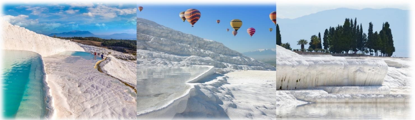
หน้า 6 (ภาพใช้เพื่อการโฆษณาเท่านั้น)

ปามุกแปลว่าฝ้าย คาเลย์แปลว่าปราสาท เป็นน้ำตกสีขาวโพลน ลดหล่นกันลงมาเป็นชั้นส่งประกายสะท้อนกับแสงแดดระยิบระยับ บนหน้าผา โตรกเขา สีขาวบริสุทธิ์ของแร่แคลเซียมที่เกาะตัวอยู่บนเนินเขา ลดหล่นลงมาตั้งป้อมปราการเกิดจากน้ำพุร้อนที่มีแร่แคลเซียมคาร์บอเนตผสมอยู่เป็นจำนวนมากในธรรมชาติ เมื่อน้ำแร่