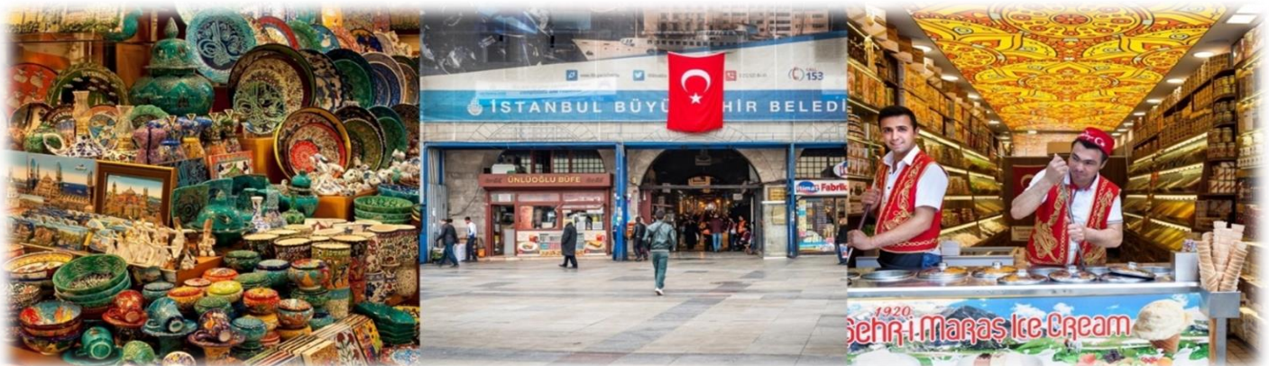
หน้า 15 (ภาพใช้เพื่อการโฆษณาเท่านั้น)

นำท่านเดินทางสู่ สไปซ์บাজার (SPICE BAZAAR) เป็นตลาดเครื่องเทศตั้งอยู่ใกล้กับสะพานกาลาตา ที่นี่ถือเป็นตลาดใหม่และเป็นตลาดที่ใหญ่เป็นอันดับสองในเมืองอิสตันบูล สร้างขึ้นตั้งแต่ช่วงปี ค.ศ. 1660 โดยเป็นส่วนหนึ่งของมัสยิดใหม่ ภายในตลาดยังมีสินค้ามากมายให้ได้เลือกซื้อ อาทิ อาหาร, เครื่องเทศ, ขนมหวานของตุรกี, เครื่องเพชรพลอย, ของที่ระลึก, ผลไม้แห้ง และเครื่องประดับต่างๆ อีกด้วย