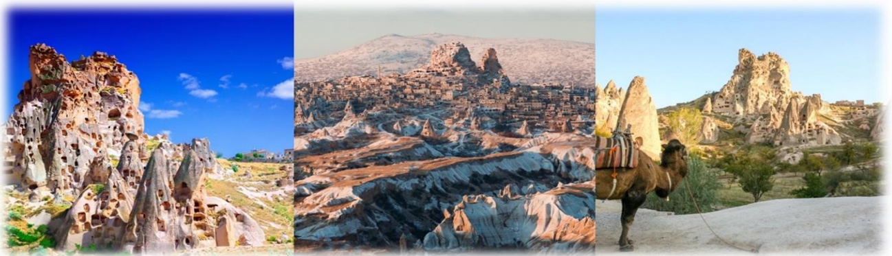
หน้า 11 (ภาพใช้เพื่อการโฆษณาเท่านั้น)

จากนั้นนำท่านถ่ายรูปด้านนอก หุบเขานกพิราบ (PIGEON VALLEY) เป็นหน้าผาที่ชาวเมืองโบราณได้ขุดเจาะเป็นรู เพื่อให้นกพิราบเข้าไปทำรังอาศัยอยู่ เนื่องจากสมัยก่อนชาวเมืองใช้นกพิราบมีหน้าที่เป็นผู้ส่ง