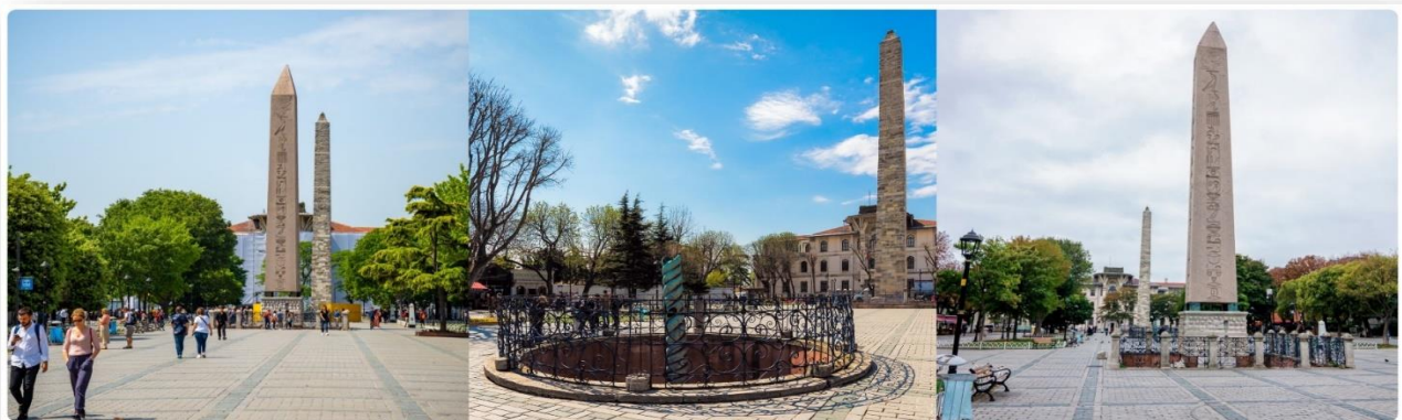
หน้า 4 (ภาพใช้เพื่อการโฆษณาเท่านั้น)

นำท่านสู่จัตุรัสสุลต่านอะห์เมตหรือฮิปโปโดรม (HIPPODROME) สนามแข่งม้าของชาวโรมัน จุดศูนย์กลางแห่งการท่องเที่ยวเมืองเก่า สร้างขึ้นในสมัยจักรพรรดิ เซปติมิอุสเซเวรุสเพื่อใช้เป็นที่แสดงกิจกรรม