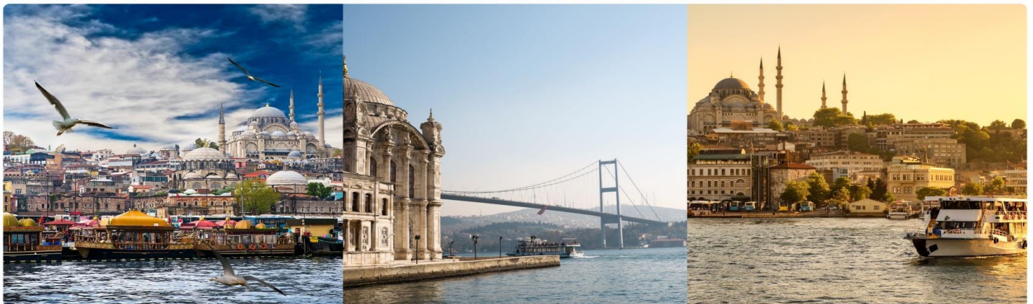
หน้า 14 (ภาพใช้เพื่อการโฆษณาเท่านั้น)

นำทุกท่าน ล่องเรือช่องแคบบอสฟอรัส จุดที่บรรจบกันของทวีปยุโรปและเอเชีย ซึ่งทำให้ประเทศตุรกีได้รับสมญานามว่า ดินแดนแห่งสองทวีป ช่องแคบบอสฟอรัสยังเป็นจุดยุทธศาสตร์สำคัญเนื่องจากเป็นเส้นทางเดินเรือที่เชื่อมทะเลดำทะเลมาร์มาร่า โดยจุดชมวิวที่สำคัญคือสะพานแขวนบอสฟอรัส เชื่อให้รถยนต์สามารถวิ่งข้ามฝั่งยุโรปและเอเชียได้ ความยาวทั้งสิ้น 1,560 เมตร และได้กลายเป็นสะพานแขวนที่ยาวเป็นอันดับ 4 ของโลกในสมัยนั้น (ปัจจุบันตกไปอยู่อันดับที่ 21) ขณะล่องเรือพร้อมดื่มด่ำกับบรรยากาศสองข้างทาง ซึ่งสามารถมองเห็นได้ไม่ว่าจะเป็นพระราชวังโดลมาบาเซ่และบ้านเรือนของบรรดาเหล่าเศรษฐีที่สร้างได้สวยงามตระการตา