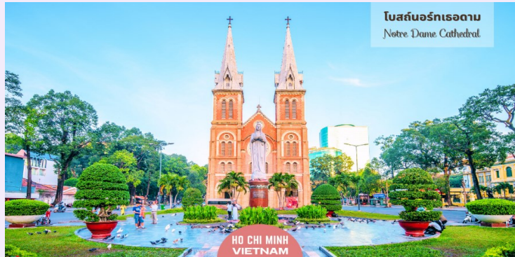
โบสถ์นอร์ทเทอดาม Notre Dame Cathedral

นำท่านถ่ายรูป มหาวิหารนอร์ทเทอ์ดาม เป็นอัญมณีทางสถาปัตยกรรมอันงดงามที่มีความสำคัญทางประวัติศาสตร์และวัฒนธรรม วิหารแห่งนี้สร้างขึ้นในยุคอาณานิคมฝรั่งเศส และเป็นสัญลักษณ์ของมรดกอันมั่งคั่งและความศรัทธายาวนานของชาวเมืองไซงอน วัสดุที่ใช้ก่อสร้างล้วนนำเข้ามาจากฝรั่งเศส เป็นการผสมผสานอิทธิพลระหว่างยุโรปและเวียดนามอย่างลงตัว ความสมบูรณ์ของโครงสร้างเป็นข้อพิสูจน์ถึงคุณภาพของวัสดุเหล่านี้ รวมถึงอิฐสีแดงที่แข็งแรงในส่วนหน้าของอาคารซึ่งมีความวิจิตรสวยงาม และยอดแหลมที่สูงตระหง่าน ภายในวิหารยังได้รับการออกแบบให้รองรับผู้คนได้ประมาณ 1,200 คน