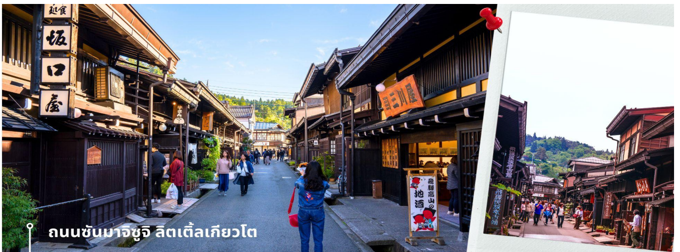
ถนนชินมาจิซุจิ ลิตเติลเกียวโต

จากนั้นให้เวลาท่านเดินเล่นสัมผัสบรรยากาศสวยงามกันต่อที่ ถนนชินมาจิซุจิ ซึ่งถูกขนานนามว่าเป็น “ลิตเติลเกียวโต” บ้านไม้โบราณโชนสีน้ำตาลดำ เรียงรายไปตามทางเดิน มีคูน้ำอยู่รอบเมือง ต้นไม้ร่มรื่นอยู่เป็นระยะ ปัจจุบันได้มีการปรับเปลี่ยนเป็นร้านค้า ร้านอาหาร ของที่ระลึก สำหรับนักท่องเที่ยวให้ได้เลือกชมทั้ง ผ้าแฮนด์เมด ชูดยูกาตะ ตุ๊กตาซารุโอะโอะ เป็นต้น หลังจากนั้นพาท่านเดินทางไปยัง AEON MALL ภายในตัวห้างมีร้านค้าต่างๆ มากถึง 150 ร้านซึ่งตกแต่งในรูปแบบที่ทันสมัยสไตล์ญี่ปุ่นสินค้ามากมายหลากหลายให้เลือกตั้งแต่เสื้อผ้าแฟชั่น อาหารสดใหม่และอุปกรณ์ภายในบ้านรวมถึงเครื่องสำอางค์ขนมญี่ปุ่นต่างๆและยังมีร้านค้ามากมายไม่ว่าจะเป็น Muji, 100 yen shop, Sanrio store, Capcom games arcade และก็ยังมิซูเปเปอร์มาร์เก็ตขนาดใหญ่ให้เราได้เลือกซื้อของอีกด้วย