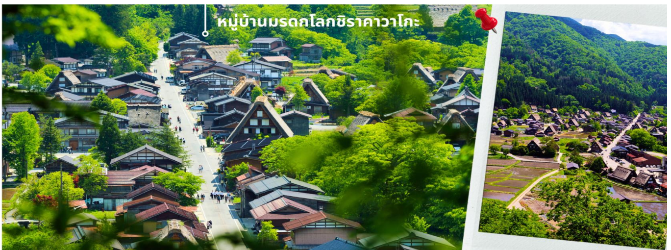
หมู่บ้านมรดกโลกชิราคาวาโกะ

หลังรับประทานอาหารเช้า นำท่านเดินทางสู่เมืองกิฟุ พาท่านเข้าชม หมู่บ้านมรดกโลกชิราคาวาโกะ หมู่บ้านแห่งนี้ตั้งอยู่ในหุบเขาสูงห่างไกลความเจริญ ทำให้ยังรักษาขนบธรรมเนียม ประเพณีอันดั้งเดิมแบบดั้งเดิมไว้ได้อย่างสมบูรณ์ และเป็นหมู่บ้านที่มีรูปร่างแปลกตาติดอันดับ ซึ่งได้ชื่อว่าเป็น The most beautiful village in Japan โดยมีบ้านทรงแบบ “กัสโซสึคุริ” ซึ่งเป็นบ้านชาวนาโบราณที่มีอายุมากกว่า 250 ปี คำว่า “กัสโซ” มีความหมายว่า “พนมมือ” ซึ่งคล้ายกับรูปแบบของบ้านที่มีหลังคามุงด้วยฟางข้าวที่ทำมุมชันถึง 60 องศา ราวกับสองมือที่ประนมเข้าหากัน ตัวบ้านมีความยาวประมาณ 18 เมตร กว้าง 10 เมตร ทั้งหลังถูกสร้างขึ้นโดยไม่ใช้ตะปู ภายหลังจากในปี 1995 ได้รับการตั้งขึ้นเป็นมรดกโลกอีกด้วย