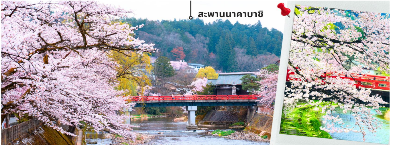
สะพานนาคาบาชิ

** ระยะเวลาการบานของดอกซากุระจะขึ้นอยู่กับสายพันธุ์และสภาพอากาศ **