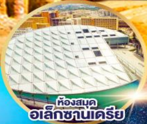
ห้องสมุด อเล็กซานเดรีย

เยือนมหาพีระมิดกิซ่าและนครรัฐเพตรา 2 สิ่งมหัศจรรย์ที่สุดของโลก