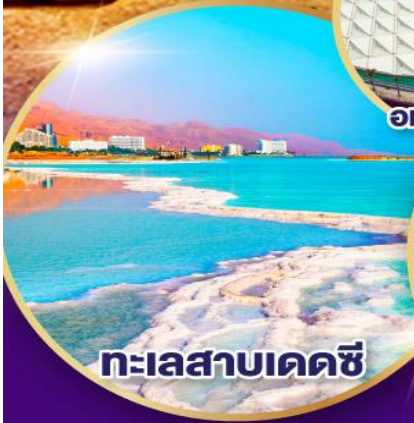
ทะเลสาบเดคซี