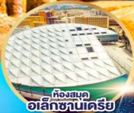
ห้องสมุด อลีกซานเดรีย