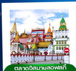
ตลาดอิสมาลอฟสกี