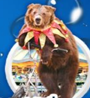
Optinal รัสเซีย เซอร์คัส