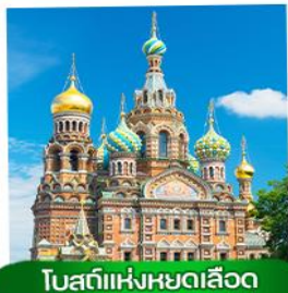
โพลีนาแห่งหยดเลือด

✓ นักรถไฟความเร็วสูง SAPSAN (มอสโก - เซนต์ปีเตอส์เบิร์ก)