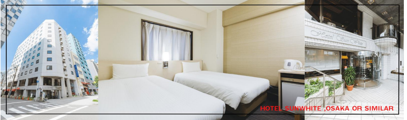
HOTEL SUNWHITE , OSAKA OR SIMILAR

เที่ยง/ค่ำ อิสระอาหารตามอัธยาศัยเพื่อสะดวกแก่การท่องเที่ยว พักที่ HOTEL SUNWHITE , OSAKA หรือเทียบเท่า