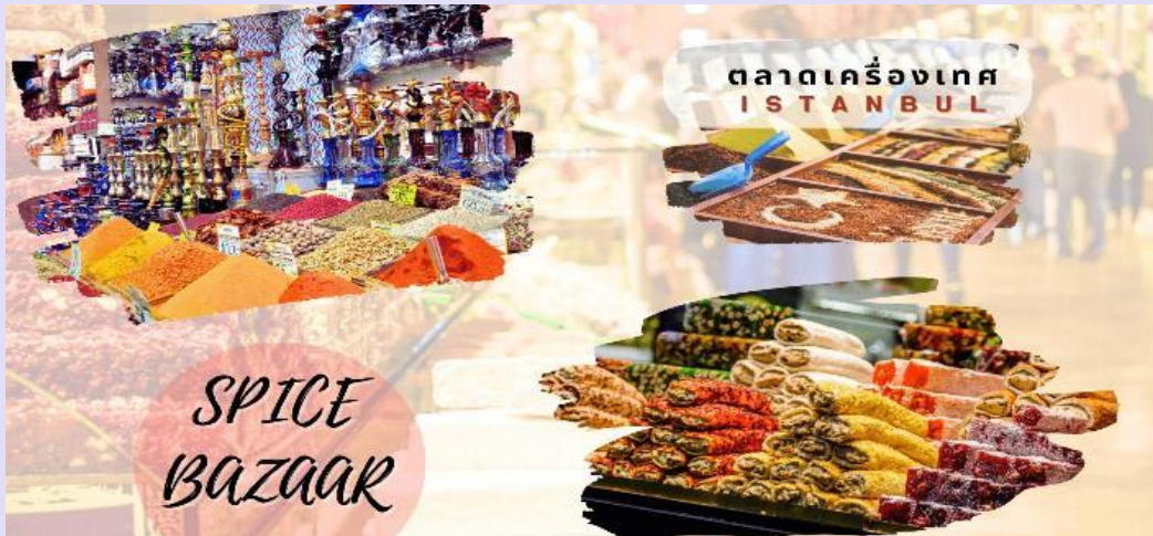
กลางวัน อิสระอาหารกลางวันตามอัธยาศัย

เดินทางสู่ ย่านการค้าชื่อดัง แกรนด์บาร์ซาร์ (Grand Bazaar) ซึ่งเป็นตลาดเก่าแก่ที่สร้างในสมัยกลาง ค.ศ. 15 เป็นตลาดค้าพรมและทองที่ใหญ่ที่สุดของตุรเคีย มีร้านค้ากว่า 4,000 ร้าน ให้ท่านได้เพลิดเพลินกับการ เลือกซื้อ สินค้าที่มีชื่อเสียงของตุรเคียอย่างจุใจ เช่น โคมไฟ, ของฝาก, ผ้าพันคอ ฯลฯ