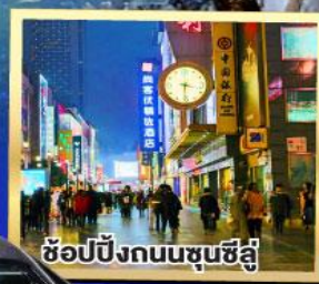
ช้อปปิ้งถนนชุนชี่สี่