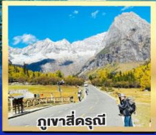
ภูเขาสี่ดรุณี