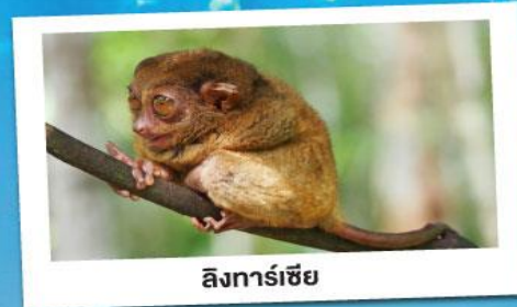
ลิ่งทาร์เซียร์