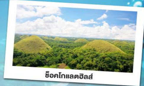
ช็อคโกแลตฮิลล์