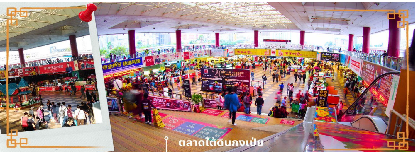
ตลาดใต้ดินกงเป่ย์

จากนั้นนำท่าน อิสระช้อปปิ้งตลาดใต้ดินกงเป่ย์ ตั้งอยู่ติดชายแดนมาเก๊า เป็นศูนย์การค้าติดแอร์ ที่มีร้านค้ามากกว่า 5,000 ร้านค้า มีสินค้าให้ท่านเลือกมากมาย เช่น สินค้าก๊อบบี้แบรนด์เนมต่างๆ ไม่ว่าจะเป็นเสื้อผ้า รองเท้า กระเป๋า นาฬิกา ของเด็กเล่น ฯลฯ ที่นี่ มีสินค้าให้เลือกซื้อหลากหลาย จึงเป็นที่นิยมมากของชาวมาเก๊าและฮ่องกง เนื่องจากสินค้าที่นี่มีคุณภาพและราคาถูก