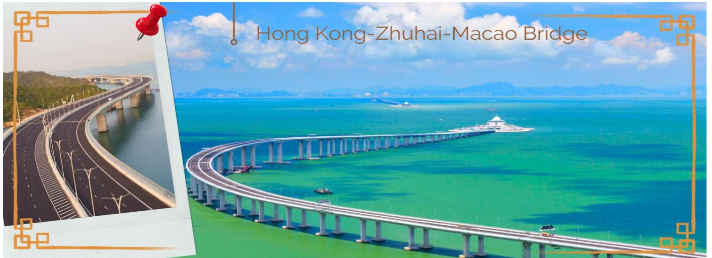
Hong Kong-Zhuhai-Macao Bridge

จากนั้นนำท่านเดินทางสู่ มาเก๊า (MACAU) หรือ เอ้าเหมิน (รถโค้ชปรับอากาศ) ด้วยการเดินทางผ่านเส้นทางสะพาน Hong kong – Zhuhai – Macao Bridge สะพานมีความยาว 55 กิโลเมตร ซึ่งเป็นสะพานข้ามทะเลที่ยาวที่สุดในโลก สะพานดังกล่าวเปิดใช้งาน เมื่อวันที่ 23 ต.ค. 2561 ซึ่งเชื่อมระหว่างเขตบริหารพิเศษฮ่องกง กับเมืองจูไห่ของมณฑลกวางตุ้ง และเขตบริหารพิเศษมาเก๊าของจีน โดยสะพานเส้นทางนี้นับเป็นครั้งแรก ที่จะช่วยลดระยะเวลาการเดินทางจาก ฮ่องกงไปยังจูไห่และมาเก๊า จากเดิม 3 ชั่วโมง ให้เหลือเพียงภายใน 1 ชั่วโมง มาเก๊า มีชื่อทางการว่า เขตบริหารพิเศษมาเก๊าแห่งสาธารณรัฐประชาชนจีน เป็นพื้นที่บนชายฝั่งทางใต้ของประเทศจีน เป็นเขตปกครองพิเศษของจีน โดยมีฐานะเป็น เขตบริหารพิเศษภายใต้หลักการ หนึ่งประเทศสองระบบ ผู้ที่อาศัยอยู่ในมาเก๊าส่วนใหญ่พูดภาษากวางตุ้งเป็นภาษาแม่ ภาษาจีนกลาง ภาษาโปรตุเกส และภาษาอังกฤษ ชาวมาเก๊า มีความหมายโดยกว้างๆ คือผู้ที่พำนักอาศัยถาวรอยู่ในมาเก๊า ส่วนในวงแคบ หมายถึง คนพื้นเมืองในมาเก๊าที่สืบทอดมาจากชาวโปรตุเกส มักจะผสมกับชาวจีนและบรรพบุรุษชาติอื่นๆ