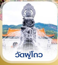
วัดฟูโกว