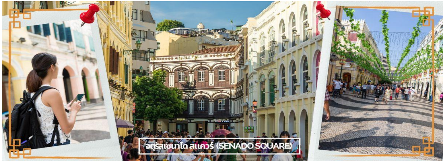
จตุรัสเซนาโด สแควร์ (SENADO SQUARE)

จากนั้นนำท่านเข้าสู่ เซนาโด สแควร์ (SENADO SQUARE) จตุรัสใจกลางเมืองมาเก๊า รายล้อมไปด้วยตึกกรมบ้านช่องและโบสถ์สไตล์ยุโรปซึ่งได้รับอิทธิพลมาจากโปรตุเกส มีพื้นที่ทั้งหมด 3,700 ตารางเมตร เป็น 1 ใน 4 จตุรัสที่ใหญ่เป็นอันดับต้นๆของมาเก๊า และในปี 2005 จตุรัสแห่งนี้ถูกขึ้นทะเบียนเป็นมรดกโลก UNESCO World Heritage ทางเดินต่างๆตกแต่งด้วยกระเบื้องและหินโมเสสหลากสีเป็นลายคล้ายคลื่นทะเล มีร้านค้าเปิดกันอยู่ทั้งสองข้างทาง เป็นทางเดินคดเคี้ยวเลี้ยวไปตามทางที่จะไปยังจุดท่องเที่ยวต่างๆ