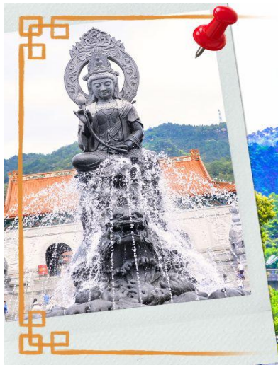
วัดผู้โถว หรือวัดผู้ถัวซาน Putuoshan Temple

จากนั้นนำท่านสู่ วัดผู้โถว หรือวัดผู้ถัวซาน (Putuoshan Temple) ดินแดนอันศักดิ์สิทธิ์ ของพระโพธิสัตว์กวนอิม พุทธศาสนิกายมหายาน พระโพธิสัตว์กวนอิมคืออวตารหนึ่งของพระอมิตาภพุทธเจ้า ซึ่งพระโพธิสัตว์กวนอิม เป็นมหาบุรุษมีวัฒนธรรมโดยรวมกว้างขวางและออกแบบด้วยรูปแบบสถาปัตยกรรมโบราณแบบดั้งเดิม