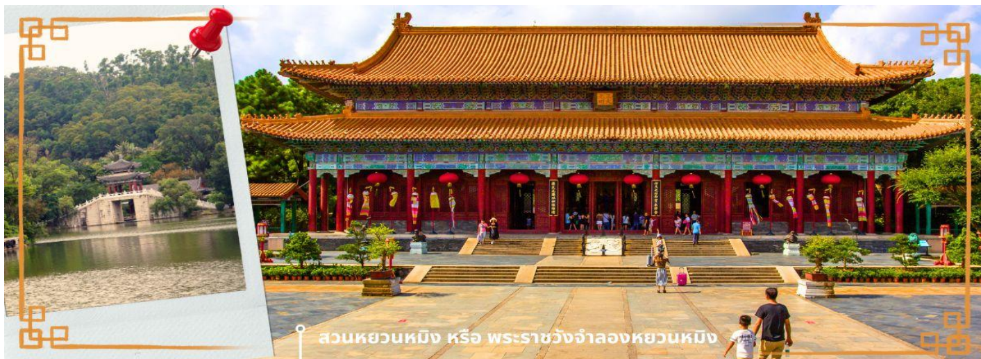
สวนหยวนหมิง หรือ พระราชวังจำลองหยวนหมิง

จากนั้นนำท่านสู่ ร้านหยก หยกในจีนโบราณจนมาถึงสมัยนี้ ยังมีความเชื่อว่าเป็นอัญมณีที่ล้ำค่าและหายาก บ่งบอกฐานะของสตรีในสมัยก่อน แต่ในสมัยนี้ เชื่อกันว่าหยกสีเขียวมันเหนียวนำโชคและความร่ำรวย ดังคำกล่าวที่ว่า“สีเขียวเหนียวทรัพย์” ถือเป็นการเสริมฮวงจุ้ยที่ดีของผู้สวมใส่อิสระให้ท่านได้เรียนรู้ชนิดของหยกและเลือกซื้อตามใจชอบจากนั้นนำท่านสู่ สวนหยวนหมิง หรือ พระราชวังจำลองหยวนหมิง ตั้งอยู่ ณ ใจกลางหุบเขาชิลิน เมืองจูไห่ สร้างขึ้นเลียนแบบพระราชวังหยวนหมิง ณ กรุงปักกิ่ง สิ่งก่อสร้างต่างๆ มากกว่า 100 ซื่น มีขนาดเท่าของจริงในอดีตทุกชิ้น อาทิ เสาหินคู่สะพานข้ามธารทอง ประตูตึกง ตำหนักเจิ้งตำกวางหมิง สะพานเก้าอี้แว่น สวนแห่งนี้โอบล้อมด้วยขุนเขาที่เขียวชอุ่ม และมีพื้นที่ครอบคลุมทะเลสาบขนาดมหึมา ซึ่งมีขนาดเท่ากับสวนเดิมในกรุงปักกิ่ง และยังมีการเพิ่มเติมและตกแต่งสวนที่เป็นศิลปะแบบตะวันตกผสมกับศิลปะจีน