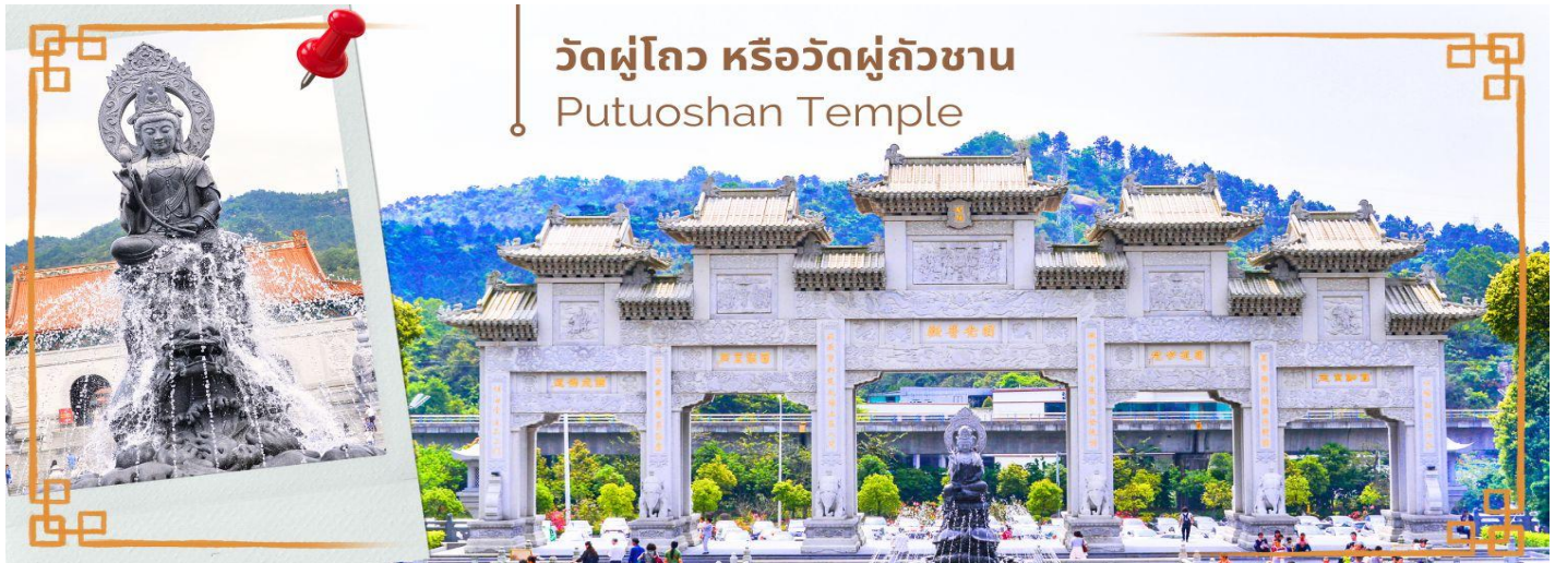
วัดผู้ไถ หรือวัดผู้ถัวซาน Putuoshan Temple

จากนั้นนำท่านสู่ วัดผู้ไถ หรือวัดผู้ถัวซาน (Putuoshan Temple) ดินแดนอันศักดิ์สิทธิ์ ของพระโพธิสัตว์กวนอิม พุทธศาสนิกายมหายาน พระโพธิสัตว์กวนอิมคืออวตารหนึ่งของพระอมิตาภพุทธเจ้า ซึ่งพระโพธิสัตว์กวนอิม เป็นมหาบุรุษมีวัตรธรรมโดยรวมกว้างขวางและออกแบบด้วยรูปแบบสถาปัตยกรรมโบราณแบบดั้งเดิม