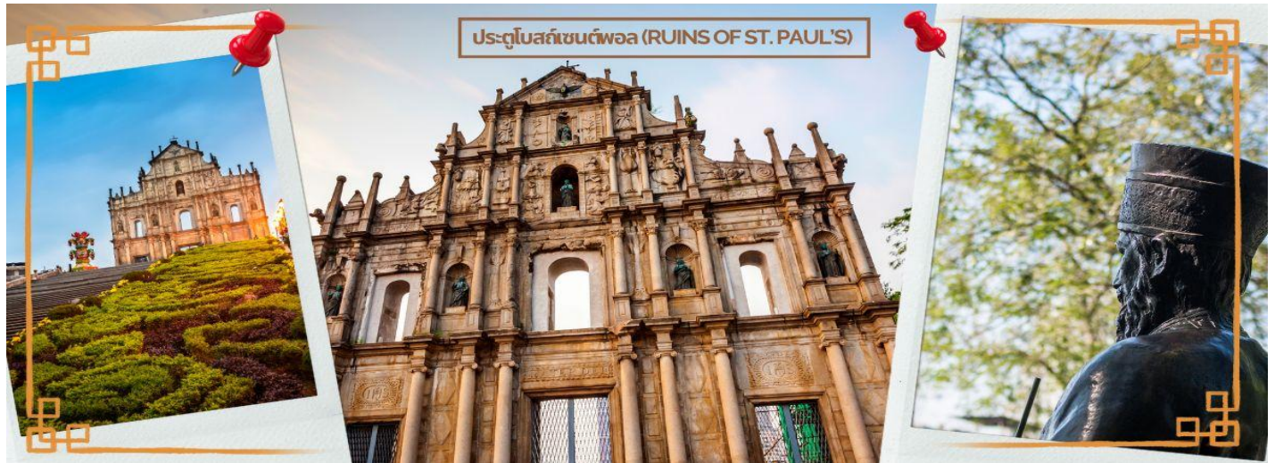
ประตูโบสถ์เซนต์พอล (RUINS OF ST. PAUL'S)

CHXH2 ฮองกง-มาเก๊า-จูไห่ 3 วัน 2 คืน บิน Hong Kong Airline (HX) JAN-MAR 25