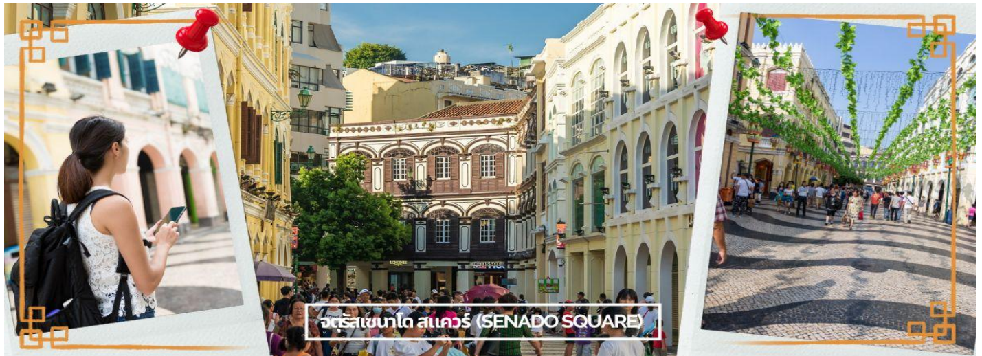
จตุรัสเซนาโด สแควร์ (SENADO SQUARE)

จากนั้นนำท่านเข้าสู่ เซนาโด สแควร์ (SENADO SQUARE) จตุรัสใจกลางเมืองมาเก๊า รายล้อมไปด้วยตึกกรมบ้านช่องและโบสถ์สไตล์ยุโรปซึ่งได้รับอิทธิพลมาจากโปรตุเกส มีพื้นที่ทั้งหมด 3,700 ตารางเมตร เป็น 1 ใน 4 จตุรัสที่ใหญ่เป็นอันดับต้นๆของมาเก๊า และในปี 2005 จตุรัสแห่งนี้ถูกขึ้นทะเบียนเป็นมรดกโลก UNESCO World Heritage ทางเดินต่างๆตกแต่งด้วยกระเบื้องและหินโมเสสหลากสีเป็นลายคล้ายคลื่นทะเล มีร้านค้าเปิดกันอยู่ทั้งสองข้างทาง เป็นทางเดินคดเคี้ยวเลี้ยวไปตามทางที่จะไปยังจุดท่องเที่ยวต่างๆ