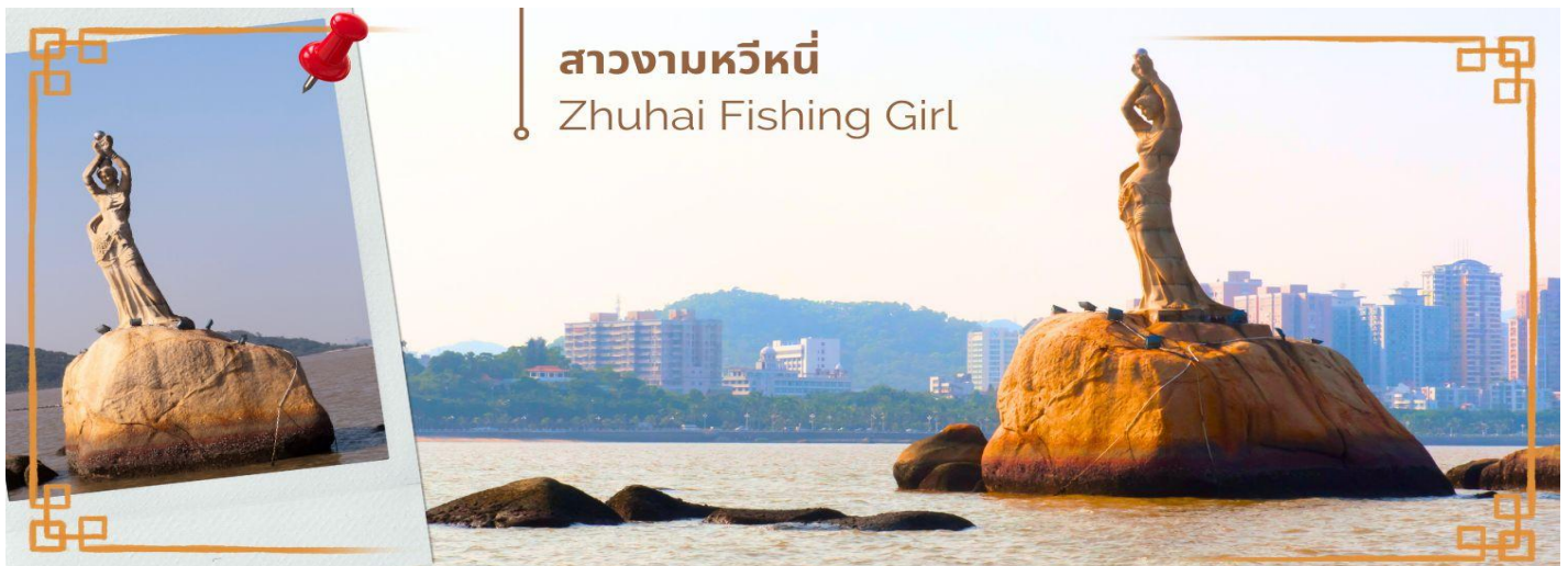
สาวงามหวีหนี่ Zhuhai Fishing Girl

จากนั้นนำท่านสู่ จูไห่ฟิชเชอร์เกิร์ล (Zhuhai Fishing Girl) หรือ สาวงามหวีหนี่ เป็นสถานที่ไฮไลท์ของเมืองจูไห่ ซึ่งเป็นจุดท่องเที่ยวอีกจุดที่สำคัญ ของเมืองนี้ เป็นรูปหินแกะสลักหญิงสาวประมงยื่นชูไม้กมยื่นออกไปในทะเล ติดริม ถนน