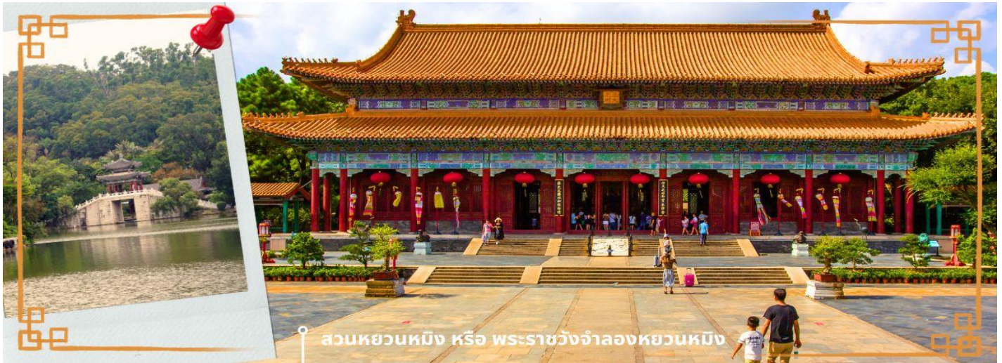
สวนหยวนหมิง หรือ พระราชวังจำลองหยวนหมิง

จากนั้นนำท่านสู่ ร้านหยก หยกในจินโบราณจนมาถึงสมัยนี้ ยังมีความเชื่อว่าเป็นอัญมณีที่ล้ำค่าและหายาก บ่งบอกฐานะของสตรีในสมัยก่อน แต่ในสมัยนี้ เชื่อกันว่าหยกสีเขียวมันเหนียวนำโชคและความร่ำรวย ดังคำกล่าวที่ว่า“สีเขียวเหนียวทรัพย์” ถือเป็นการเสริมฮวงจุ้ยที่ดีของผู้สวมใส่อิสระให้ท่านได้เรียนรู้ชนิดของหยกและเลือกซื้อตามใจชอบจากนั้นนำท่านสู่ สวนหยวนหมิง หรือ พระราชวังจำลองหยวนหมิง ตั้งอยู่ ณ ใจกลางหุบเขาซิลิน เมืองจูไห่ สร้างขึ้นเลียนแบบพระราชวังหยวนหมิง ณ กรุงปักกิ่ง สิ่งก่อสร้างต่างๆ มากกว่า 100 ชั้น มีขนาดเท่าของจริงในอดีตทุกชิ้น อาทิ เสาหินคู่สะพานข้ามธารทอง ประตูตึกง่าม ตำหนักเจิ้งต๋าวางหมิง สะพานเก้าอี้หวาย สวนแห่งนี้โอบล้อมด้วยขุนเขาที่เขียวชอุ่ม และมีพื้นที่ครอบคลุมทะเลสาบขนาดมหึมา ซึ่งมีขนาดเท่ากับสวนเดิมในกรุงปักกิ่ง และยังมีการเพิ่มเติมและตกแต่งสวนที่เป็นศิลปะแบบตะวันตกผสมกับศิลปะจีน