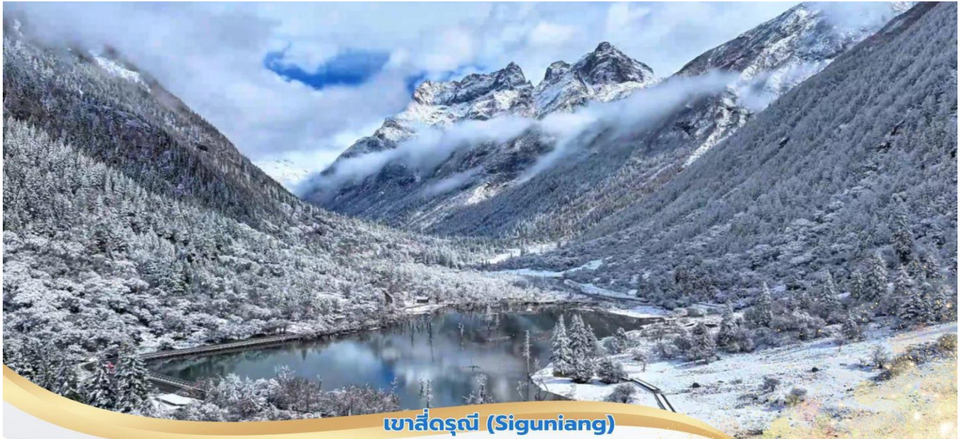
เขาสีดรุณี (Siguniang)

คำ บริการอาหารคำ ณ ภัตตาคาร ที่พัก XIQIANG HOMELAND HOTEL ระดับ 4* หรือเทียบเท่า