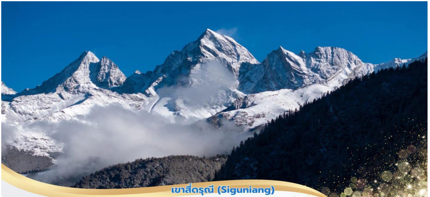
ภูเขาสี่ดรุณี (Siguniang)

นำท่านเดินทางต่อสู่ เขตอุทยานภูเขาสี่ดรุณี (Siguniang) หรือชื่อเรียกเป็นภาษาจีนว่า ชื่อภูเขาหิมะ ตั้งอยู่ในอุทยานฉางผิง เขตปกครองตนเองอาป้า มณฑลเสฉวน ทางตะวันตกเฉียงใต้ของจีน มีเนื้อที่กว่า 2,000 ตารางกิโลเมตร ปัจจุบันได้รับการขึ้นทะเบียนเป็นอุทยานแห่งชาติระดับ 5A