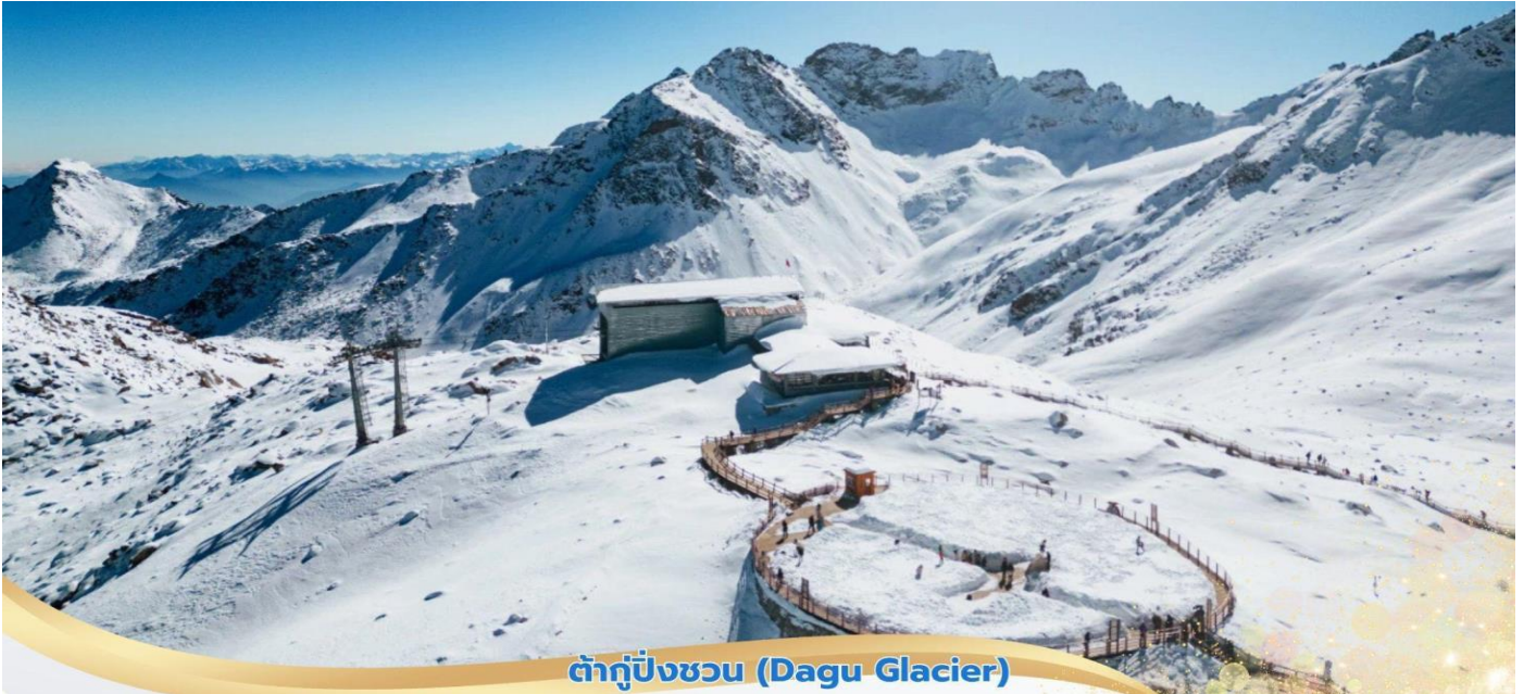
ต๋ากู๋ปิ่งชว่น (Dagu Glacier)

บ่าย นำท่านชมทิวทัศน์ของภูเขาและทะเลสาบเชิงเขา จากนั้นนำท่านนั่งกระเช้าคอนโดล่า 6 - 8 ที่นั่ง มีระยะทาง 1,226 เมตร ขึ้นไปที่ความสูง 3,400 เมตรจากระดับน้ำทะเล ชมภูเขาหิมะ 3 ลูก ที่เชื่อว่าเป็นสันหลังมังกรที่มีความงามที่เป็นภูเขาหิมะสีขาว ตัดกับท้องฟ้าสีครามสดใส