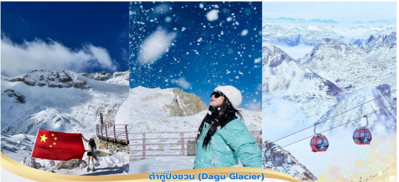
ต๋ากู๋ปิ่งชว่น (Dagu Glacier)

พาท่านชมทะเลสาบต๋ากู๋ หรืออีกชื่อ ทะเลสาบน้ำมนต์ขอฟส ซึ่งมีเรื่องราวเล่าขานของชนเผ่าชาวพื้นเมืองว่าหากมีเรื่องร้อนใจให้กราบไหว้เทพเจ้าที่คุ้มครองทะเลสาบแห่งนี้ จะทำเรื่องร้อนใจคลายลง หรือใครขอฟสต่อเทพเจ้าคุ้มครองทะเลสาบแห่งนี้ก็จะสมหวังดังที่ขอฟสไว้ทำให้ทะเลสาบแห่งนี้ถือเป็นทะเลสาบที่มีความสำคัญมากและมีประวัติความเป็นมาที่ยาวนานกว่า 1,000 ปี