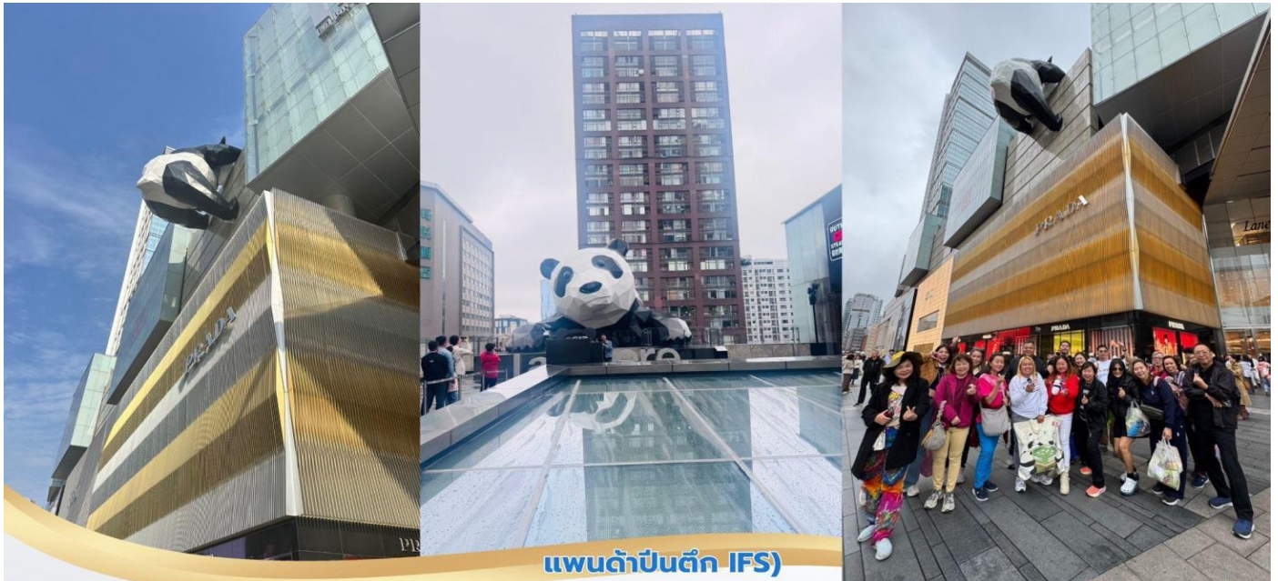
แพนด้ายักษ์ (IFS)

บ่าย จากนั้นนำท่านสู่ ถนนคนเดินชุนซีลู่ เป็นย่านวัยรุ่นเปรียบได้กับสยามสแคว์ ซึ่งขายสินค้าที่ทันสมัย เป็นถนนที่ปิด ไม่ให้รถวิ่งผ่านได้ ห้างดังในย่านนี้ทำให้เลือกช้อปปิ้งมากมายหลากหลาย จากนั้นนำท่านชม หมีแพนด้ายักษ์ กำลังปั้นตึก IFS เป็นอีกหนึ่งแลนด์มาร์ค ที่ใครมาเจ๋งดูแล้วต้องมาเช็กอิน หรือ เลือกช้อปปิ้ง ไอเท็มสุดฮิตที่ร้าน POP MART สายสะสมน้อง Labubu ไม่ควรพลาด