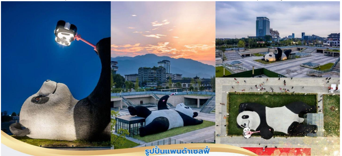
รูปปั้นแพนด้าเซลฟี่

จากนั้นนำท่านสู่ จตุรัสหย่างเทียนวู่ ที่เชื่อมตูเจียงเจี้ยนได้เปิดต่อสาธารณชนอย่างเป็นทางการ ชมรูปปั้นผลงานศิลปะ แพนด้าเซลฟี่ รูปลักษณะที่น่ารักของประติมากรรมชิ้นนี้ดึงดูดนักท่องเที่ยวจำนวนมากให้มา “เช็กอิน” “แพนด้า” มีความน่ารักน่าเอ็นดูมาก นักออกแบบ แนะนำว่าผลงานแพนด้ามีความสุข ด้วยท่าทางสบายๆ ผ่อนคลายและมีความสุข และเป็นการแสดงออกด้วยภาษาทางศิลปะแบบหนึ่งที่มีอบความสุขให้กับผู้พบเห็น