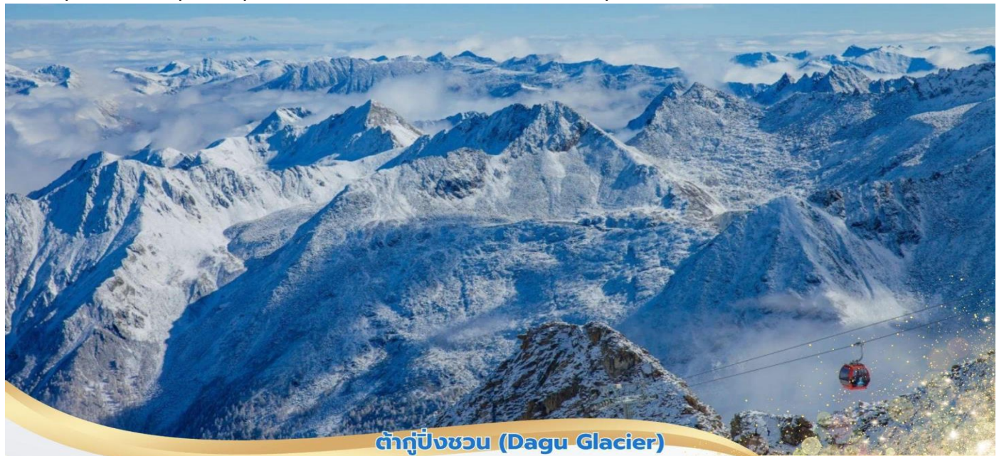
ต้ากู่ปังชว่น (Dagu Glacier)

นำท่านเดินทางสู่ อุทยานต้ากู่ปังชว่น (Dagu Glacier National Park) ใช้เวลาเดินทางประมาณ 3 ชั่วโมง ตั้งอยู่ที่เมืองเฮ่ย์ชุย (Heishui) ในมณฑลเสฉวน เป็นอุทยานทางธรรมชาติระดับ 4A ที่มีความสวยงามของภูเขาหิมะ และทะเลสาบบนยอดเขาที่มีความสูงจากระดับน้ำทะเลประมาณ 5,286 เมตร ถูกค้นพบผ่านดาวเทียมเมื่อปี ค.ศ. 1992 โดยนักวิทยาศาสตร์ชาวญี่ปุ่น หลังจากได้ตรวจสอบพื้นที่จึงทราบว่าที่เป็นธารน้ำแข็งที่ตั้งอยู่ต่ำที่สุดใหญ่ที่สุด และยังมีอายุน้อยที่สุดในโลกอีกด้วย เป็นธารน้ำแข็งที่งดงามที่สุด ซึ่งก่อตัวมาเป็นเวลาหลายร้อยล้านปี