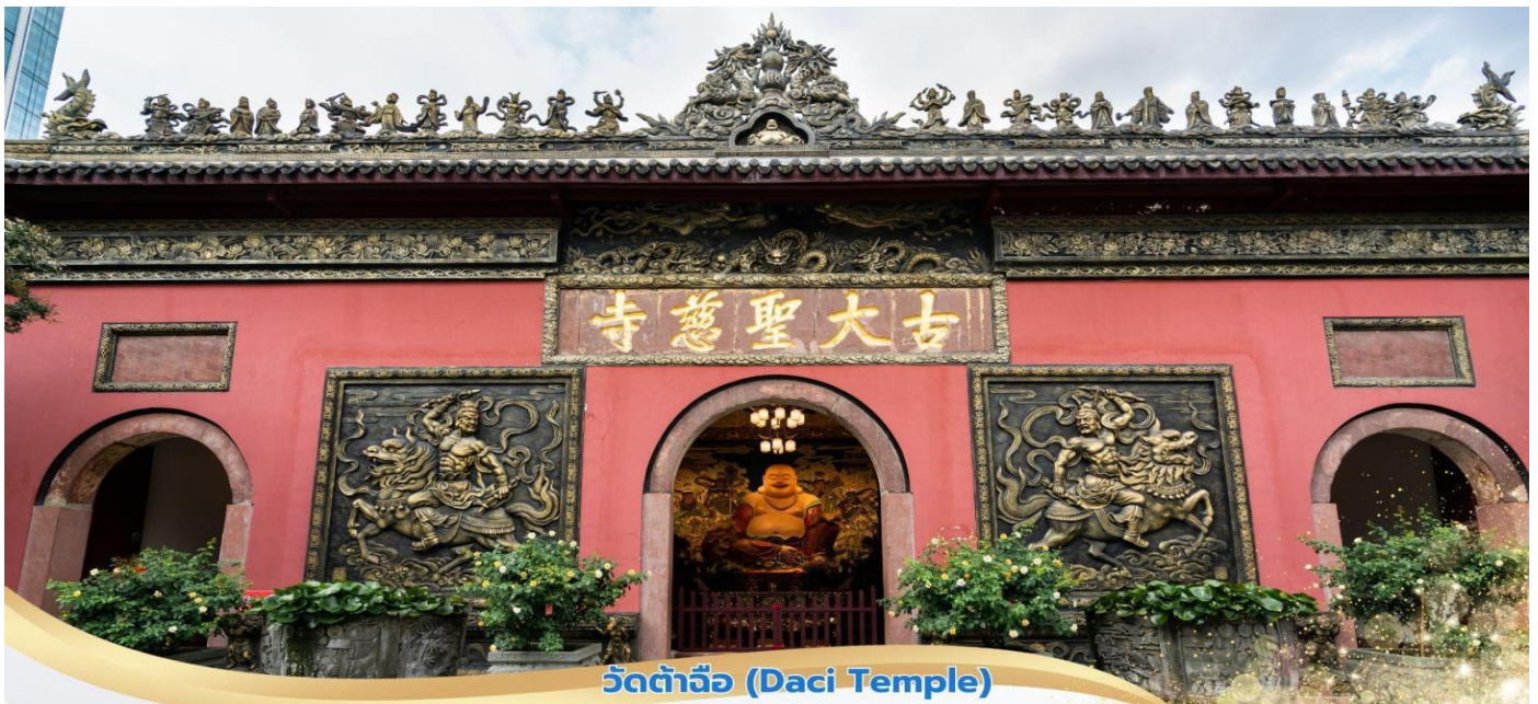
วัดต้าจื่อ (Daci Temple)

จากนั้นนำท่านเดินทางสู่ เมืองเจิงตุ ให้ท่านพักผ่อนชมวิวทิวทัศน์ที่สวยงามระหว่างสองข้างทาง จากนั้นเดินทางไปยัง วัดต้าจื่อ เป็นวัดเก่าแก่ที่มีอายุยาวนานกว่า 1,600 ปี ตั้งอยู่ใจกลางของเจิงตุ ที่นี้ถือเป็นสถานที่สำคัญที่น่าสนใจ เพราะเป็นวัดที่พระถังซำจั๋งบวชเป็นพระภิกษุก่อนจะย้ายไปจำพรรษายังวัดอื่นภายในวัดต้าสือนั้นเงียบสงบ