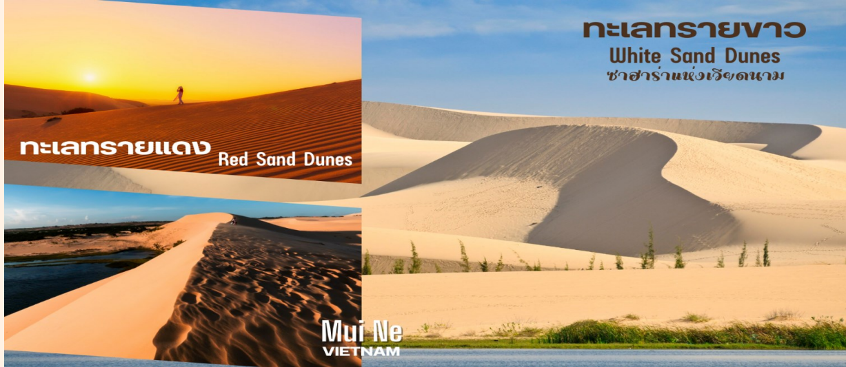
ทะเลทรายแดง Red Sand Dunes