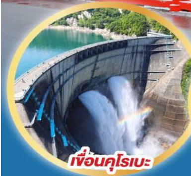
เขื่อนคุโรเบะ