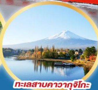
ทะเลสาบคาวากุจิโกะ