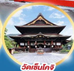
วัดเซ็นโคจิ