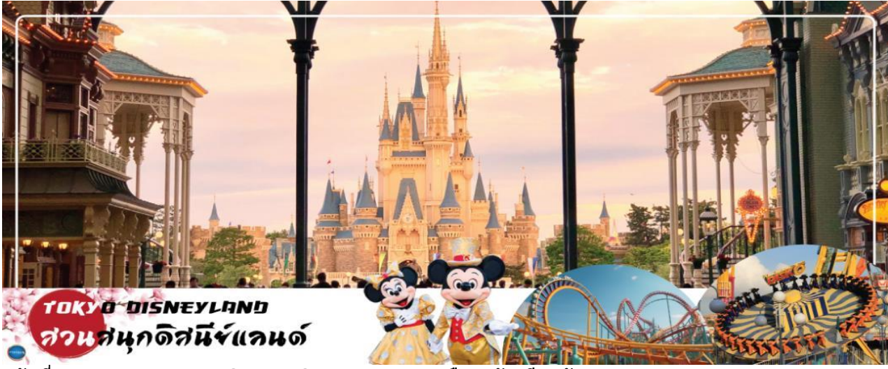
TOKYO DISNEYLAND สวนสนุกดิสนีย์แลนด์

***อิสระรับประทานอาหารกลางวันและอาหารค่ำตามอัธยาศัย***