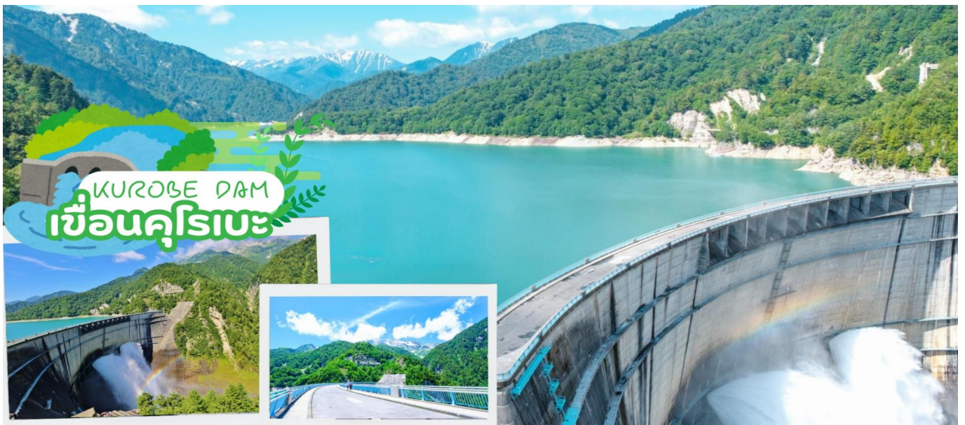
GO2NGO-TG061-- JAPAN ALPS SNOW WALL TAKAYAMA BIWA OSAKA 6D 4N BY TG

ชม เขื่อนคุโรเบ ซึ่งเป็นเขื่อนยักษ์กั้นน้ำที่ใหญ่ที่สุดในประเทศญี่ปุ่น จะมีสายรุ้งพาดผ่านตลอดปี ที่โอบล้อมด้วยภูเขาอันบร้อยลูกและชมทัศนียภาพของวงล้อมเขาหิมะ มีความสูงถึง 186 เมตร และมีความกว้างถึง 492 เมตร ซึ่งใช้เวลาตั้งแต่เริ่มบุกเบิกจนเสร็จสิ้นประมาณ 45 ปี เฉพาะตัวเขื่อนใช้เวลาในการสร้าง 4 ปี โดยจะใช้เวลาเดินเท้าเพื่อข้ามเขื่อน 800 เมตร จากนั้นนำท่านนั่ง เคเบิลคาร์ ลอดภูเขาจาก สถานีคุโรเบ ไปยัง สถานีคุโรเบไดระ ระยะทางประมาณ 800 เมตร ซึ่งเป็นเคเบิลคาร์แห่งเดียวในญี่ปุ่นที่ลอดภูเขาตั้งแต่ต้นจนสุดเส้นทาง ทั้งนี้เพื่อหลีกเลี่ยงหิมะที่ตกรุนแรงมากในฤดูหนาวจากนั้นนำท่านโดยสาร กระเช้าไฟฟ้า ที่ไม่มีเสากลางตลอดช่วง 1,710 เมตร สู่ ยอดเขาไดคังโบ จากนั้นนำท่านเดินทางผ่านอุโมงค์ที่ลอดใต้ภูเขาทาเทยาม่าที่มีความยาว 3.6 กิโลเมตร นับเป็นอุโมงค์ที่อยู่สูงที่สุดในญี่ปุ่น