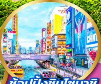
ช้อปปิ้งชินจิบาชิ