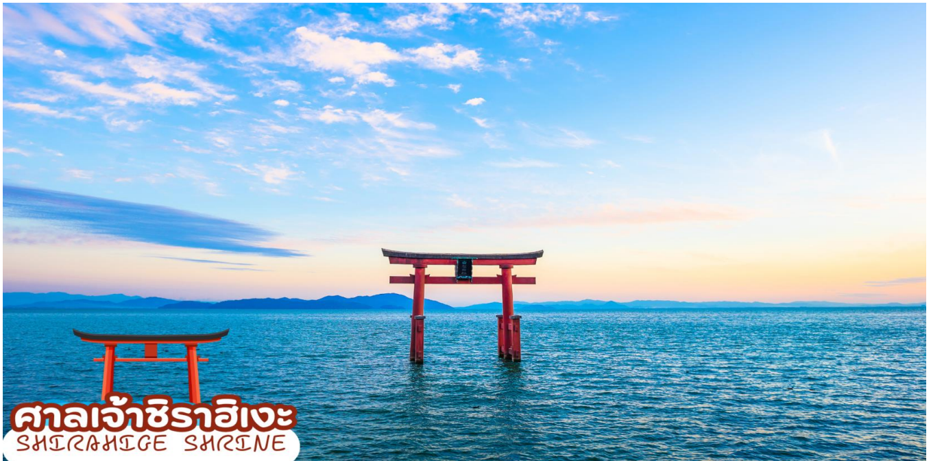
ศาลเจ้าชิราฮิเงะ SHIRAHIGE SHRINE

ชม ศาลเจ้าชิราฮิเงะ (Shirahige Shrine) ตั้งอยู่บนชายหาดของฝั่งทะเลสาบบิวะ ถือว่าเป็นศาลเก่าแก่ ศาลเจ้าชินโต มีชื่อเสียงโด่งดังในเรื่องของ เสาโทริอิ ตั้งสง่าอยู่กลาง ทะเลสาบบิวะ สร้างขึ้นในทศวรรษที่ 17 รุ่งเชื่อกันว่าศาลเจ้าแห่งนี้เป็นที่สถิตของเทพเจ้าที่ให้โชคในเรื่องการมีอายุยืนยาว ของเรื่องคู่ครอง ขอให้มิบุตร ขอให้ธุรกิจราบรื่น