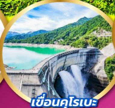
เขื่อนคุโรเบะ