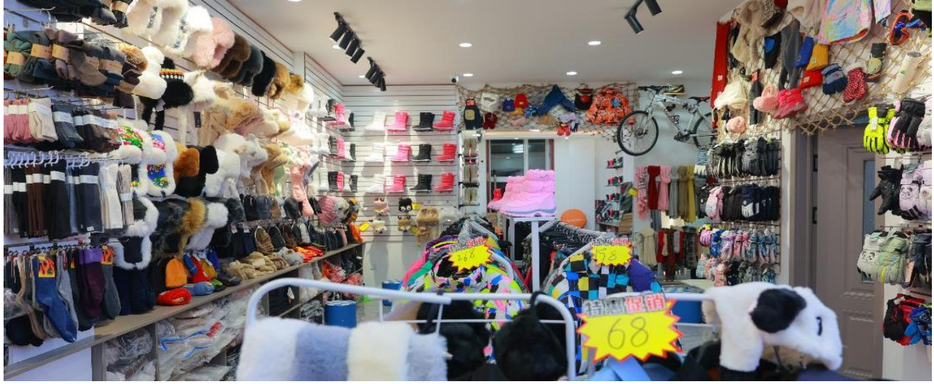
เดินทางสู่ เมืองมู่ตันเจียง เป็นเมืองเล็กๆ ตั้งอยู่ในวนอุทยานแห่งชาติ XUEXIANG (ใช้เวลาในการเดินทางประมาณ 6 ชั่วโมง)