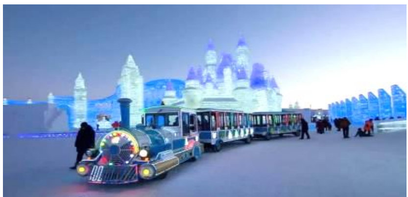
VHRB75XJ-41 ฮาร์บิน ตรุษจีน ผลิตเลือก ครบทุกอย่าง 7 วัน 5 คืน BY XJ

ภายในบริเวณงาน Harbin International Ice and Snow Festival มีรถไฟฟ้าบริการ ท่านละประมาณ 50 หยวน ทั้งนี้โปรดสอบถามราคาและการบริการอีกครั้ง เนื่องจากในแต่ละปีเงื่อนไขการให้บริการต่างกันออกไป