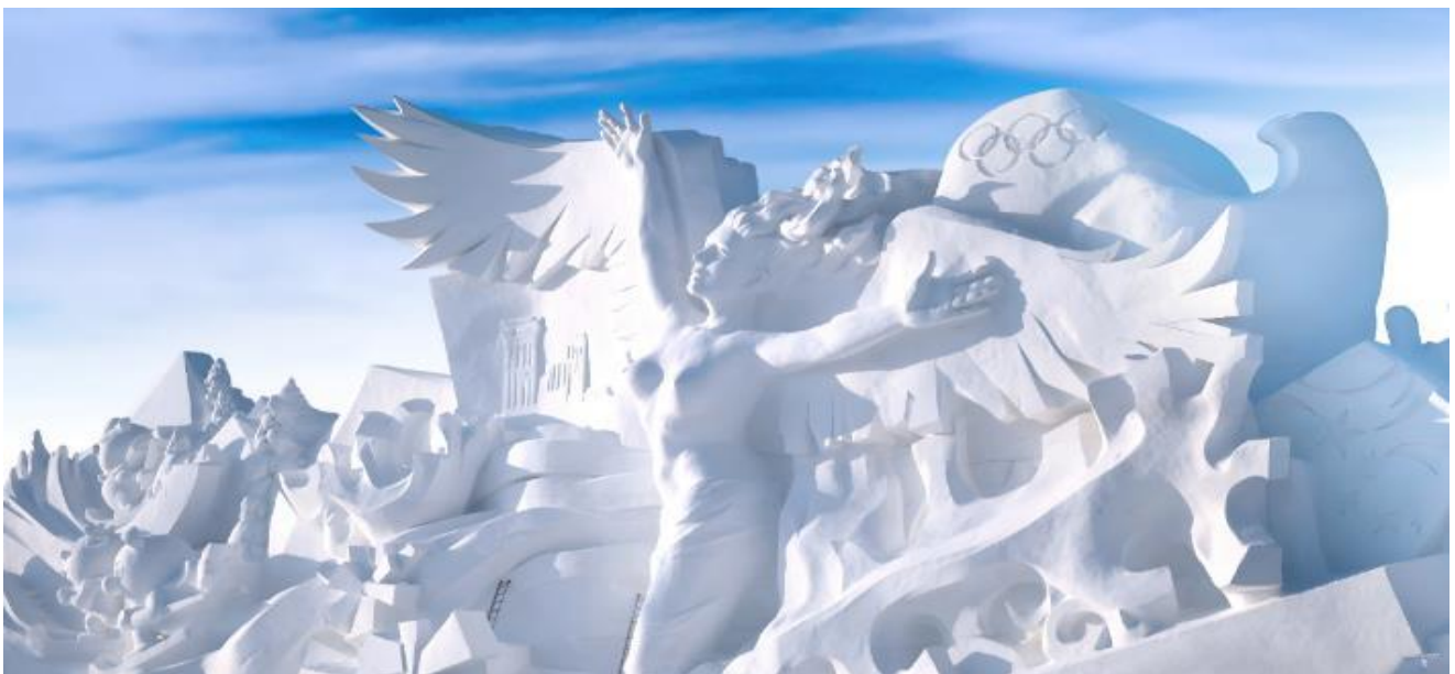
VHRB75XJ-41 ฮาร์บิน ตรุษจีน ฉลาดเลือก ครบทุกอย่าง 7 วัน 5 คืน BY XJ

(หมายเหตุ : กรณีที่เกาะพระอาทิตย์ปิด เนื่องจากอาการซ่อมบำรุง หรือภัยธรรมชาติ หรือทางการประกาศปิดทางบริษัทขอสงวนสิทธิ์ในการปรับเปลี่ยนเป็นที่เที่ยวอื่นแทน)