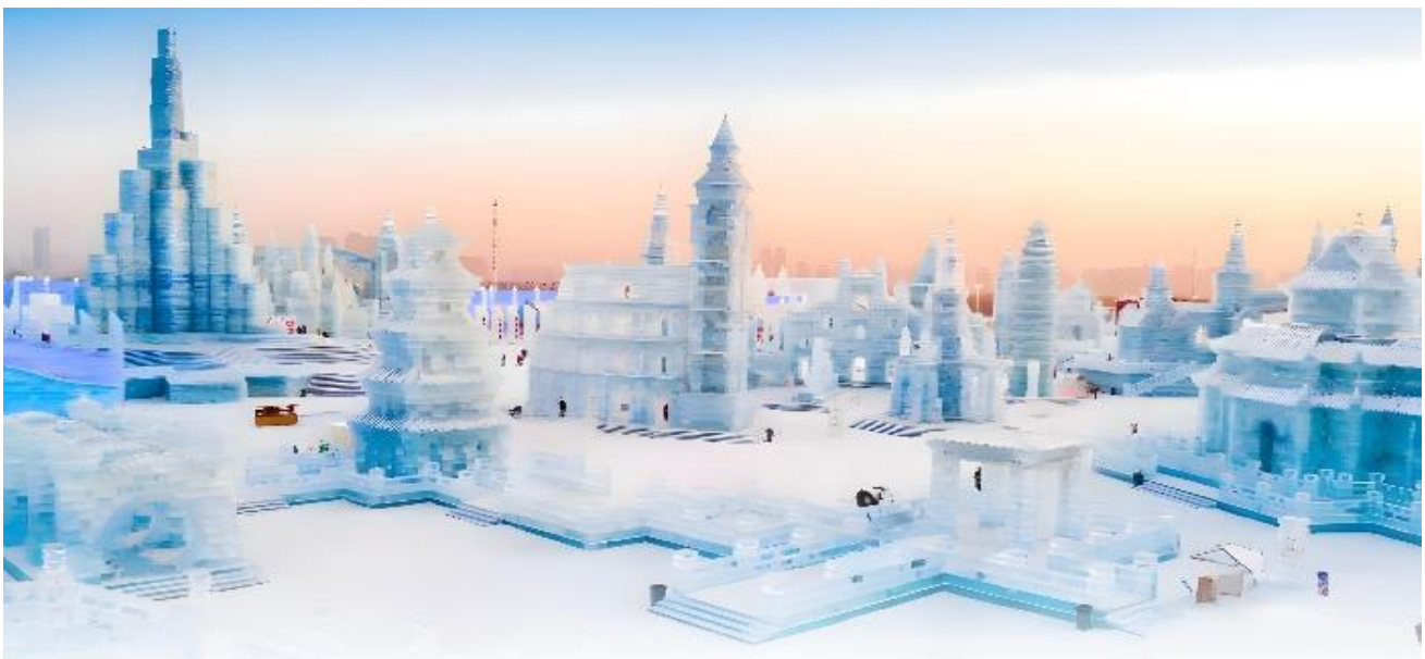
VHRB75XJ-41 ฮาร์บิน ตรุษจีน ฉลาดเลือก ครบทุกอย่าง 7 วัน 5 คืน BY XJ