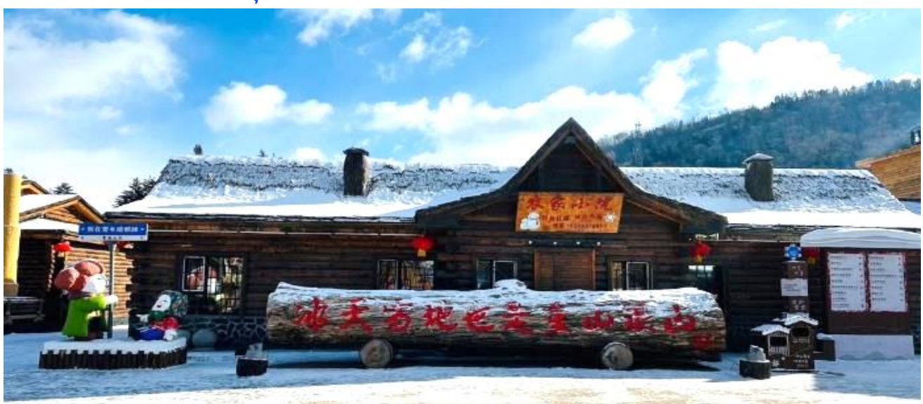
VHRB75XJ-41 ฮาร์บิน ทรูชิจิน ฉลาดเลือก ครบทุกอย่าง 7 วัน 5 คืน BY XJ

(หมายเหตุ : ปริมาณของหิมะ และความหนาแน่นของหิมะนั้น ขึ้นอยู่กับสภาพอากาศในแต่ละปี หากสภาพอากาศไม่เอื้ออำนวยส่งผลให้หิมะละลาย ทางบริษัทขอสงวนสิทธิ์ ไม่คืนค่าใช้จ่ายทุกกรณี เนื่องจากอยู่นอกเหนือความควบคุมของบริษัท)