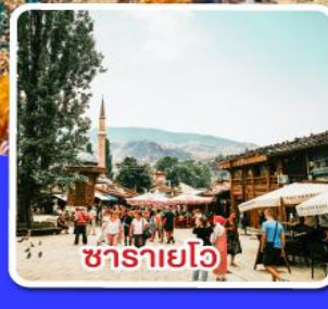
ซาราเยโว