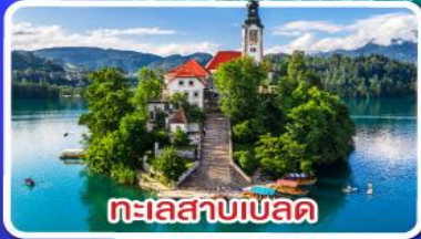
ทะเลสาบเบล็ด

ไข่มุกแห่งอาเดรียติก พร้อมขึ้นกระเช้า SRD