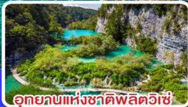
อุทยานแห่งชาติพลิตวิเช่