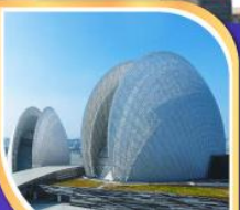
โรงละครหยองโง่บุก