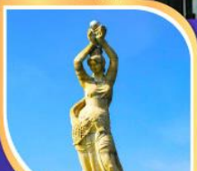
จูไห่พีชชอร์ทิรา