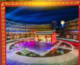
โชว์พื้นเมืองที่บ้านดินกู่ไหลอวี่