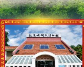
เกาะเปียวโน