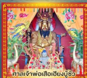
ศาลเจ้าพ่อเสือฮียงบู๊ซิว