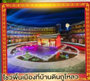
โชว์พื้นเมืองที่บ้านดินกู่ไหลอว