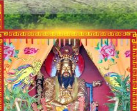
ศาลเจ้าพ่อเสือฮี้งบู๊ซิว